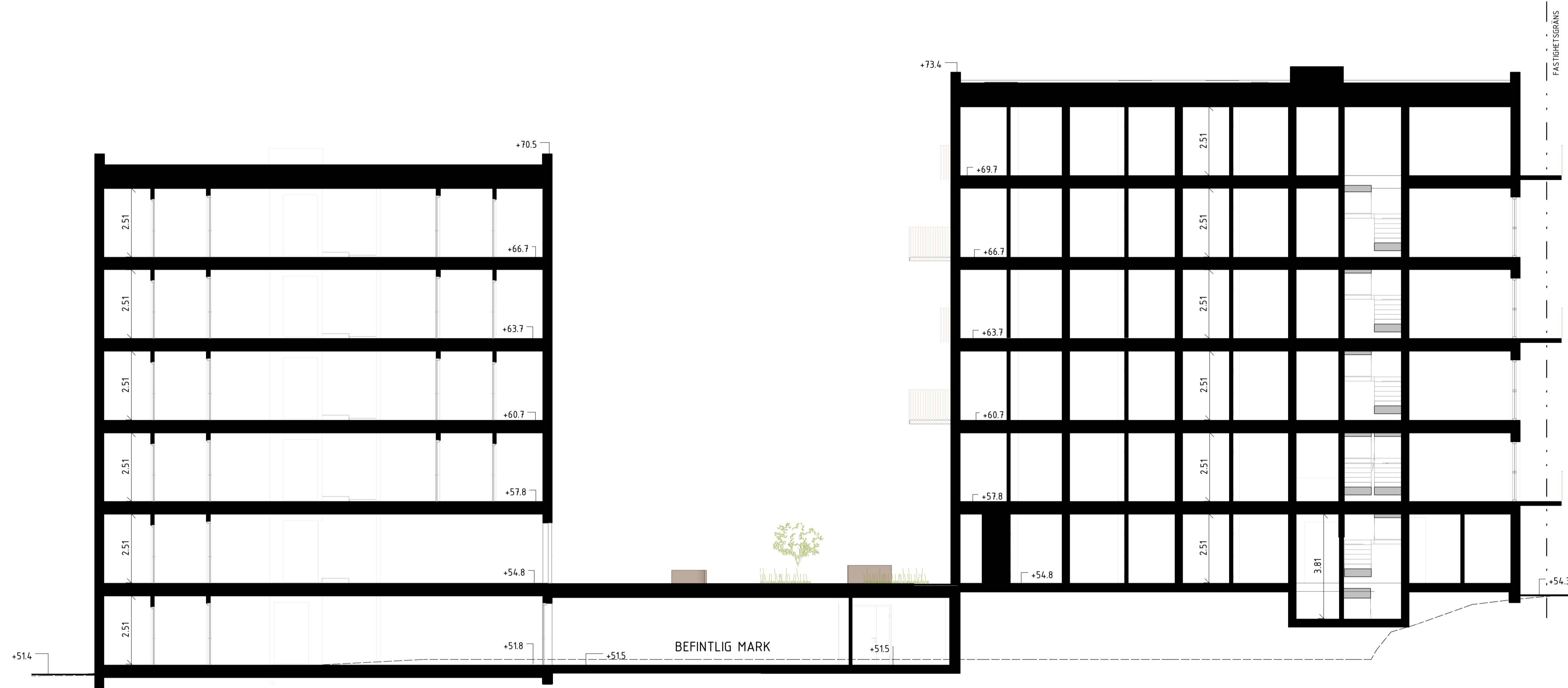
SEKTION F-F 1:100