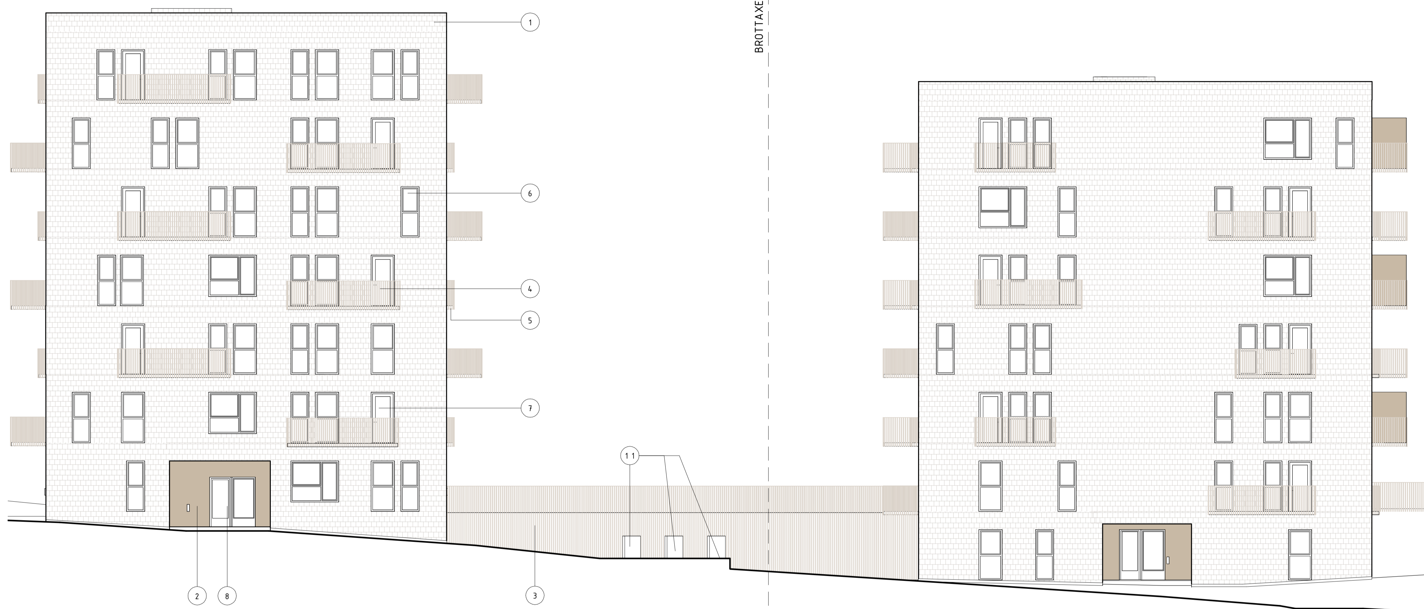
FASAD MOT NORR, HUS 2 1 : 100