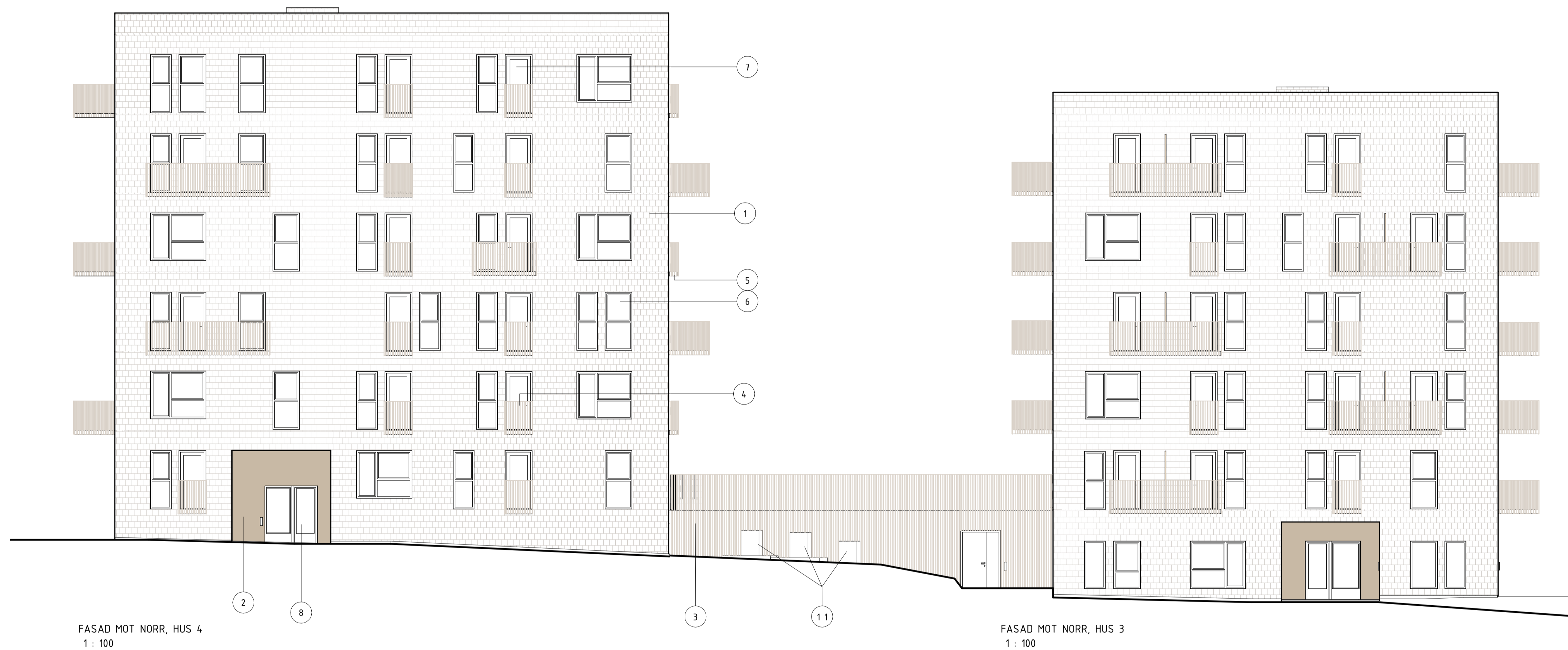
FASAD MOT NORR, HUS 4 1 : 100