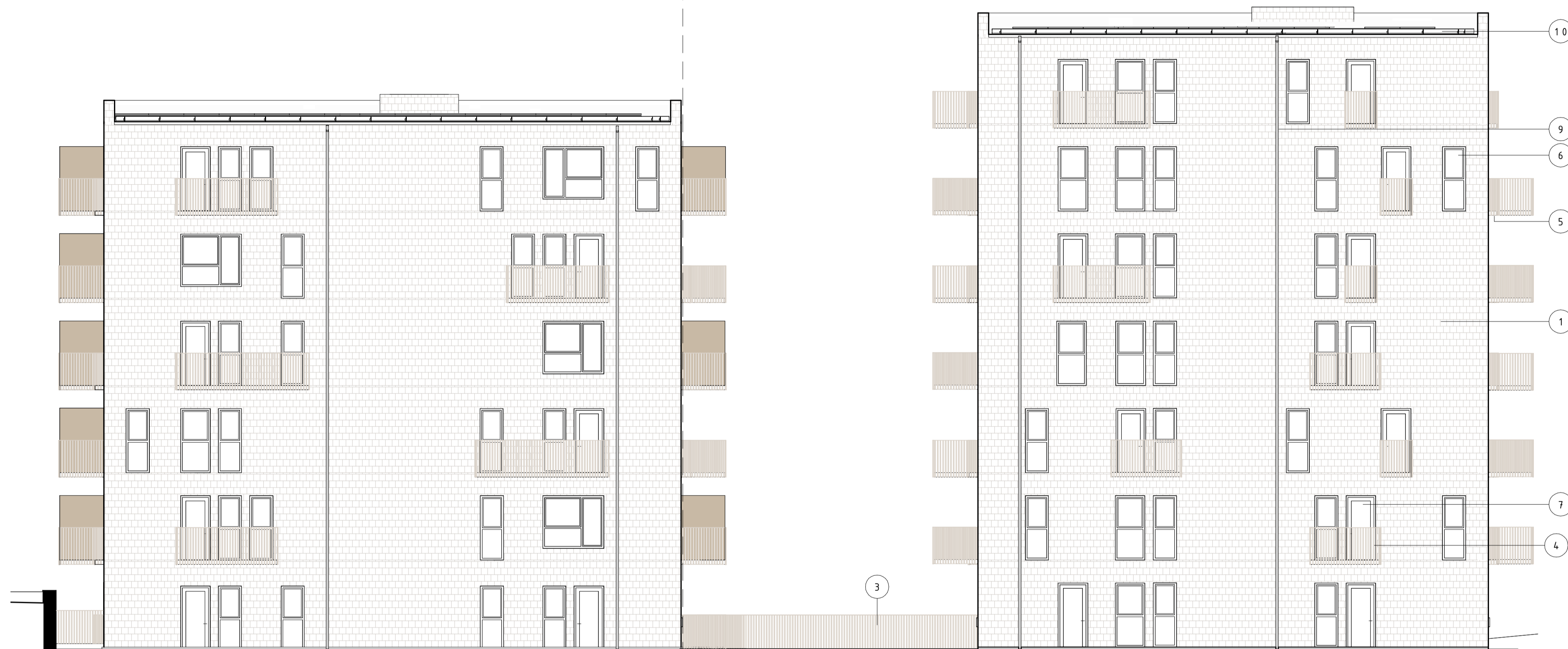
FASAD MOT SÖDER, HUS 1 1 : 100