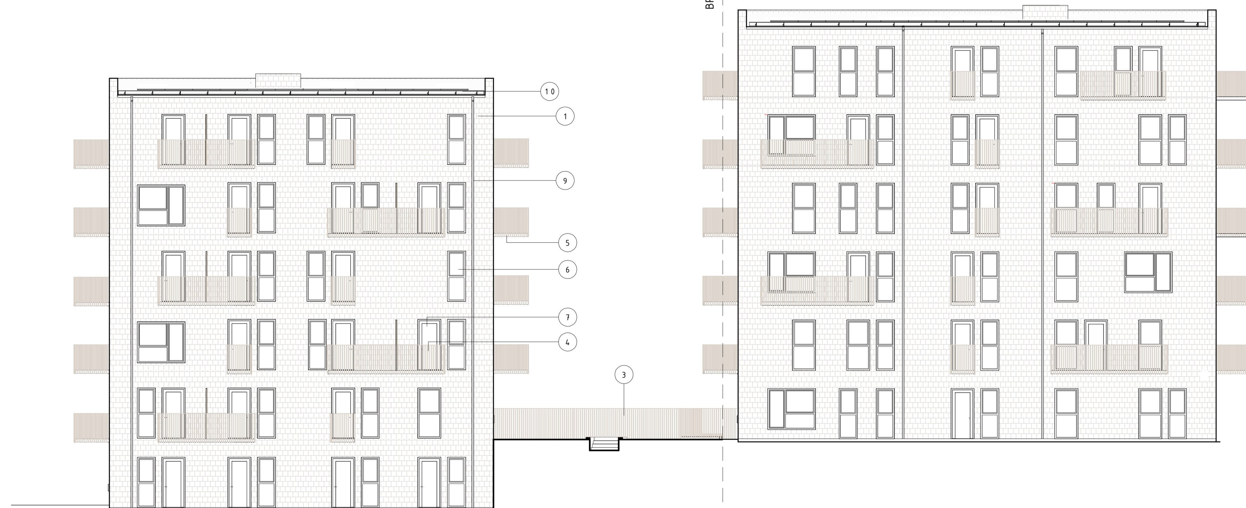
FASAD MOT SÖDER, HUS 3 1 : 100