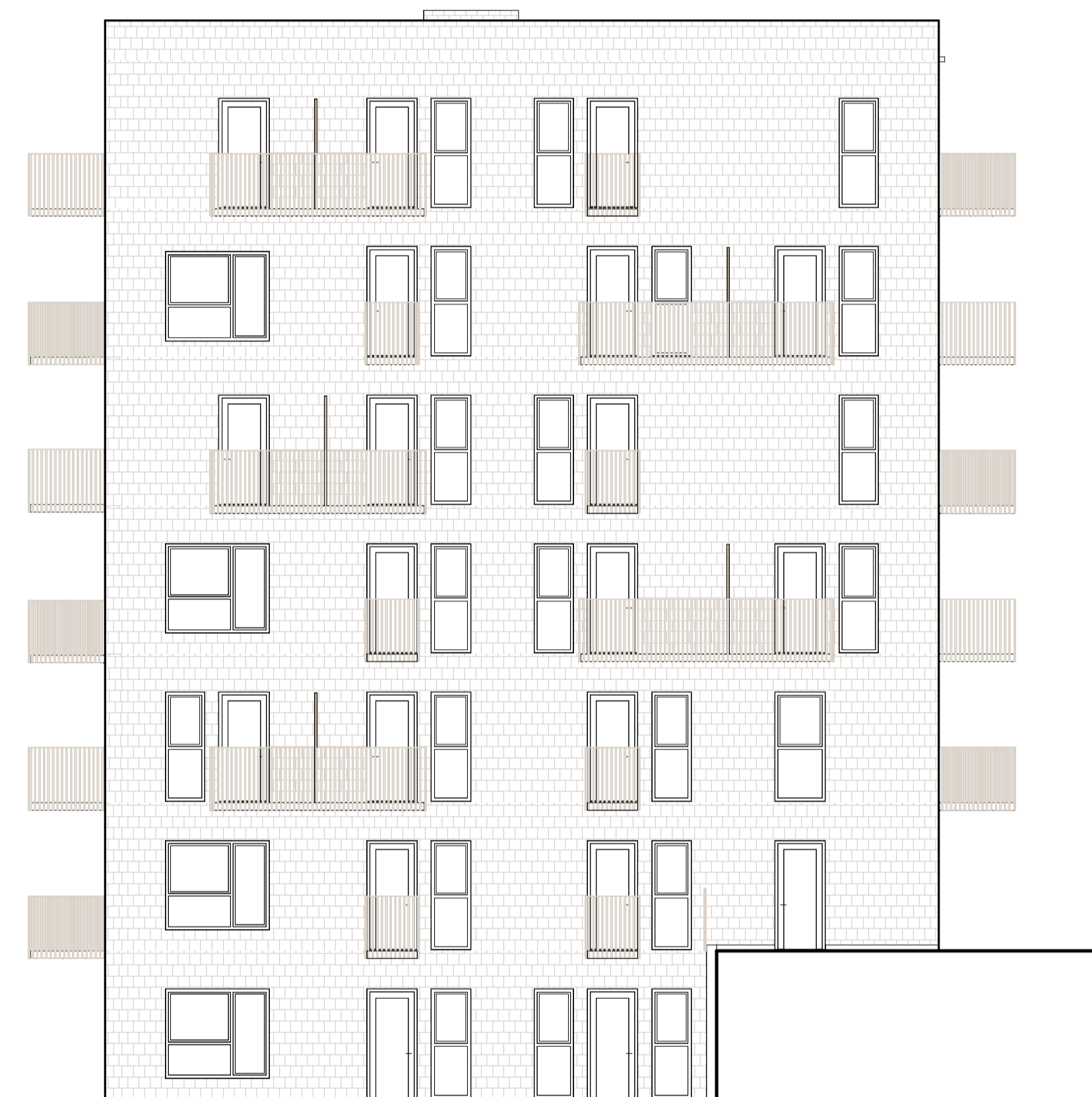
FASAD MOT VÄST, HUS 1 1 : 100