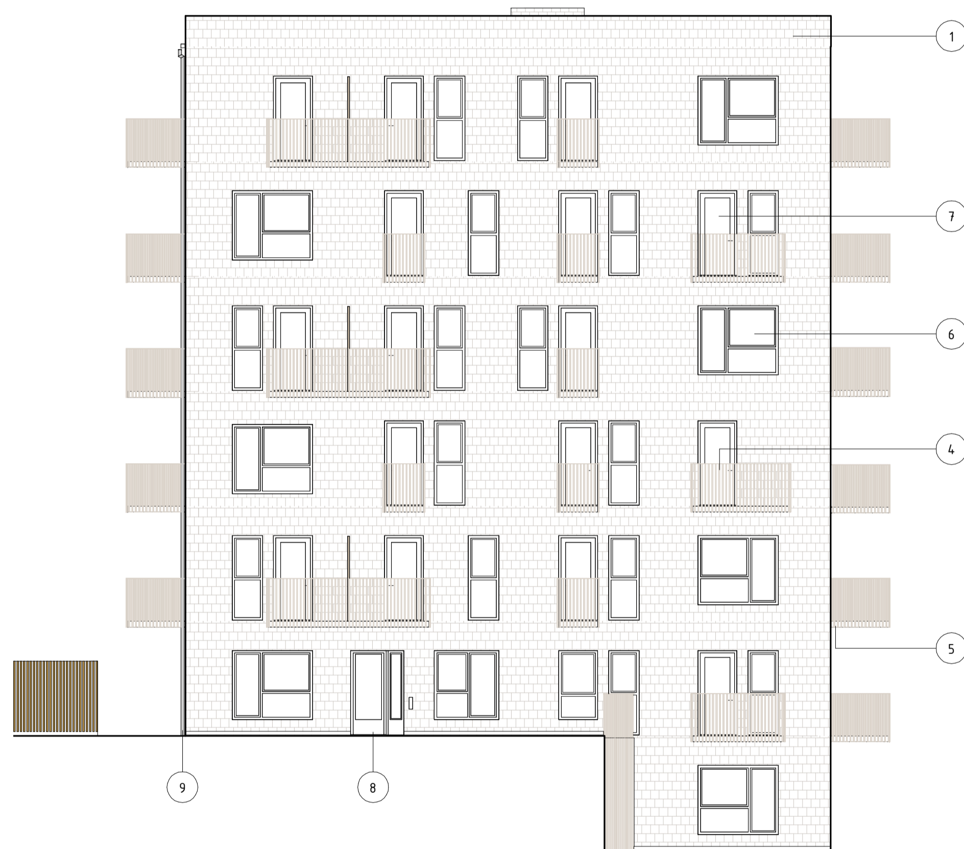
FASAD MOT ÖST HUS 1 1 : 100