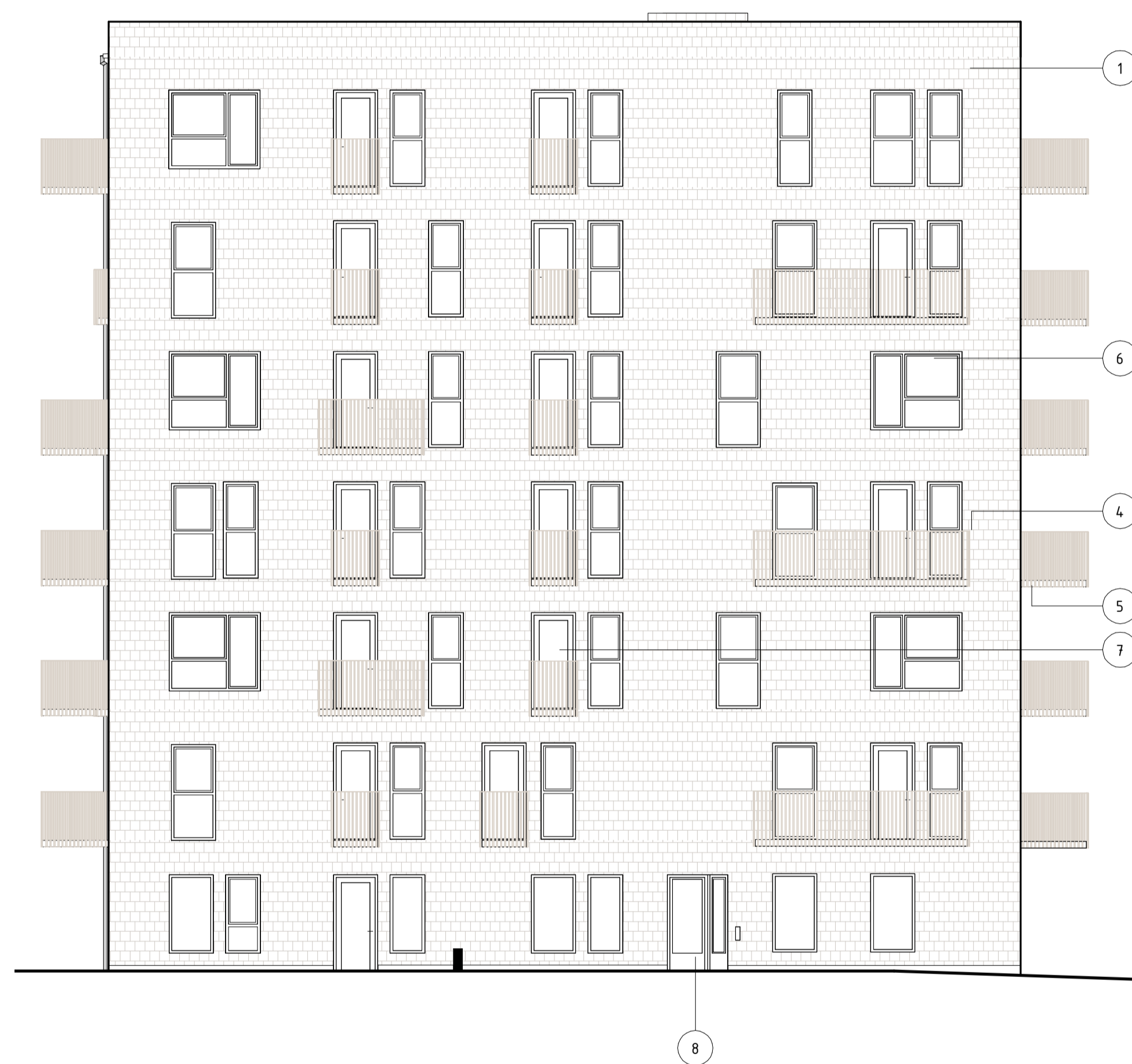
FASAD MOT ÖST, HUS 2 1 : 100