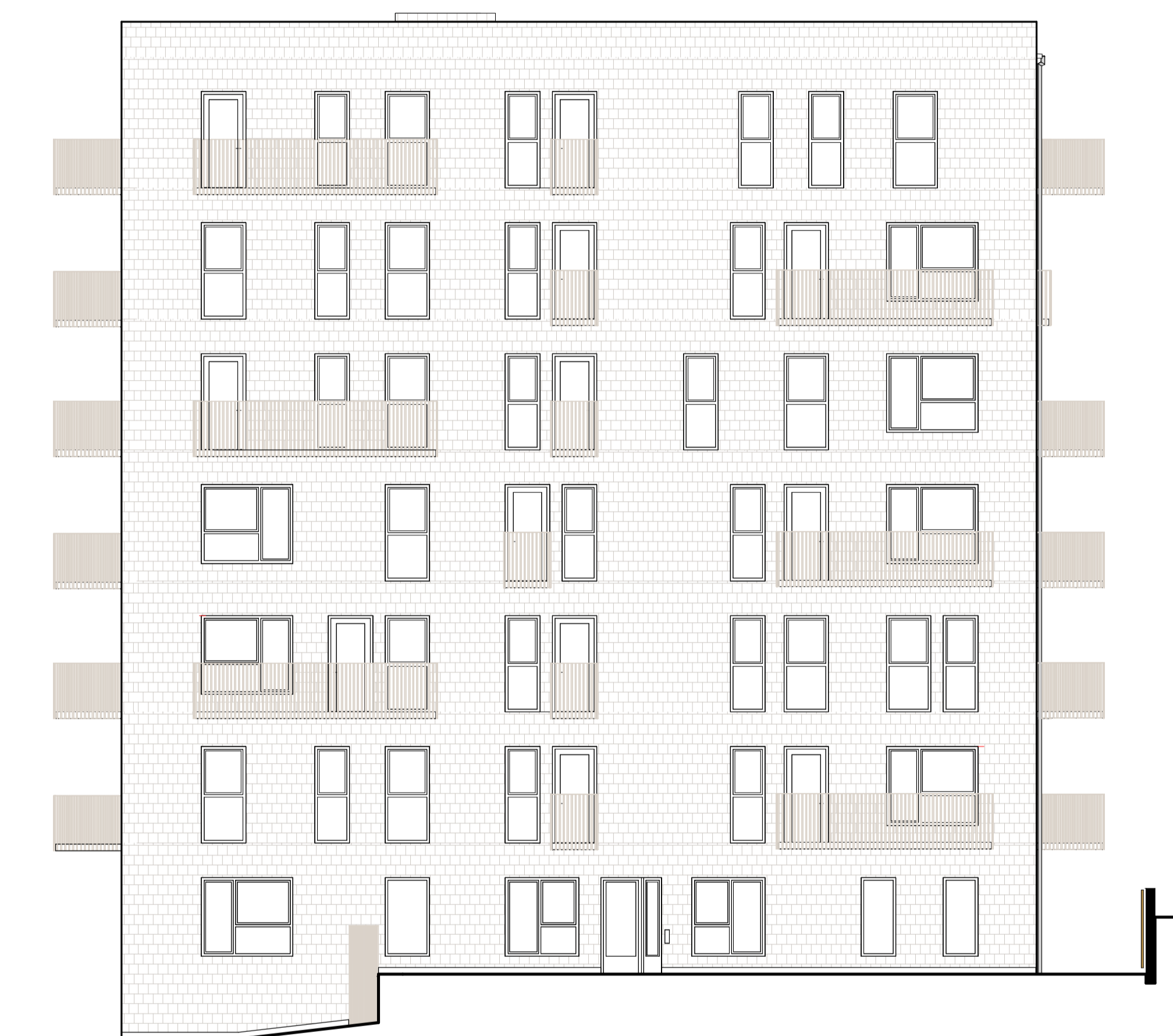
FASAD MOT VÄST, HUS 2 1 : 100