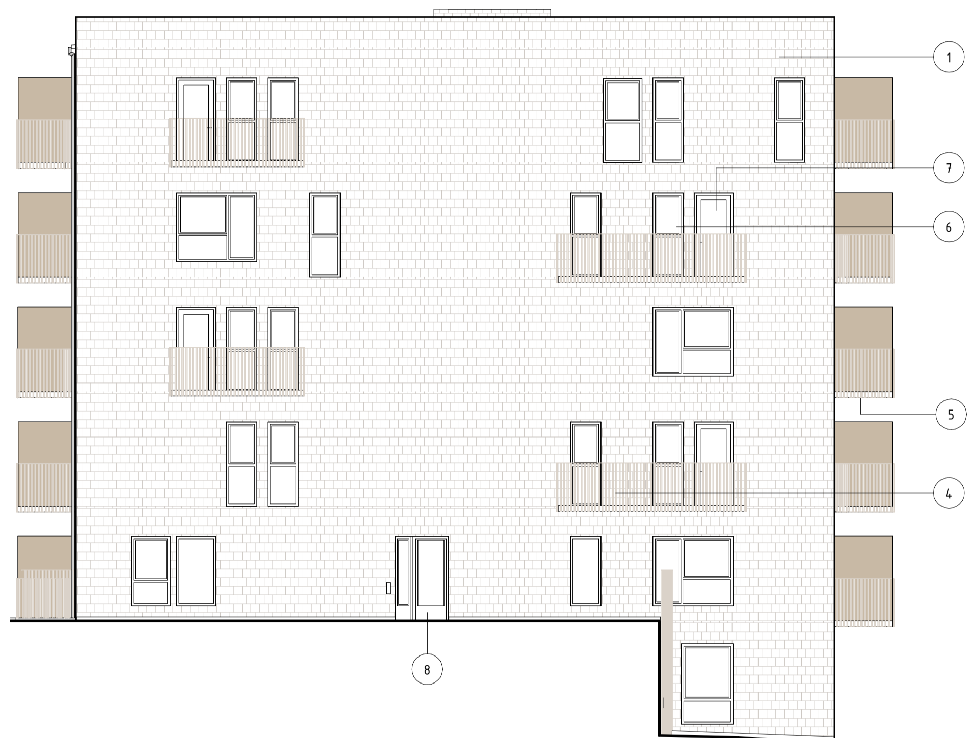
FASAD MOT ÖST, HUS 3 1 : 100