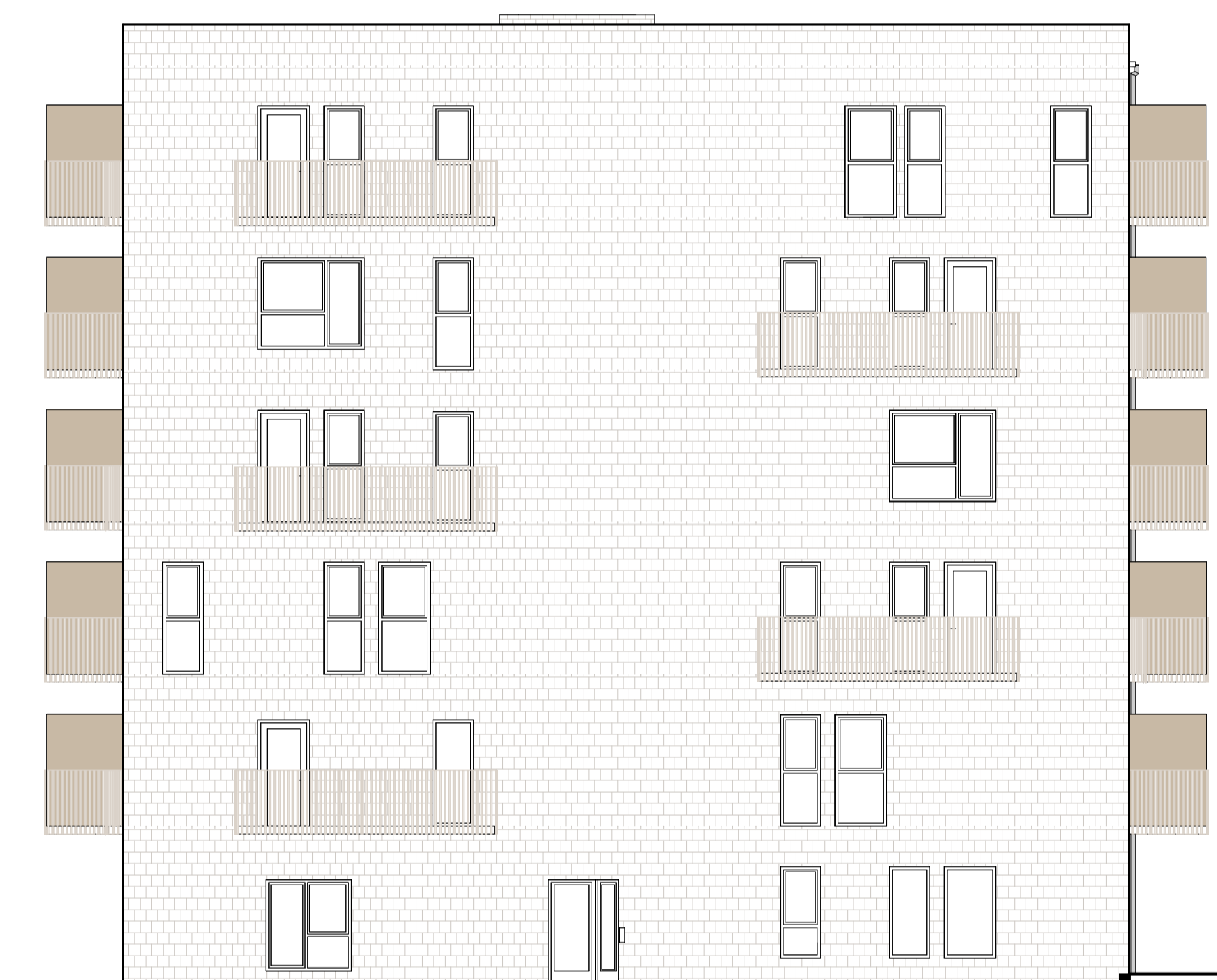
FASAD MOT VÄST, HUS 3 1 : 100