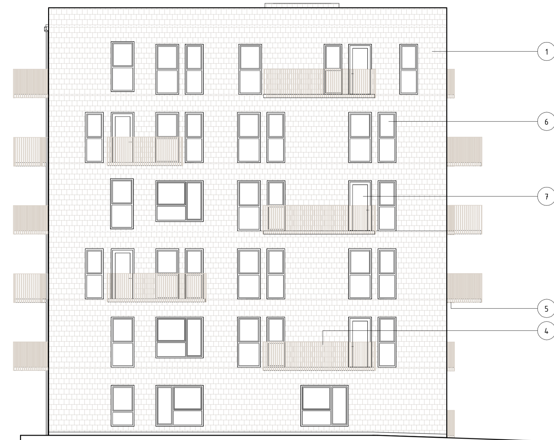
FASAD MOT ÖST, HUS 4 1 : 100