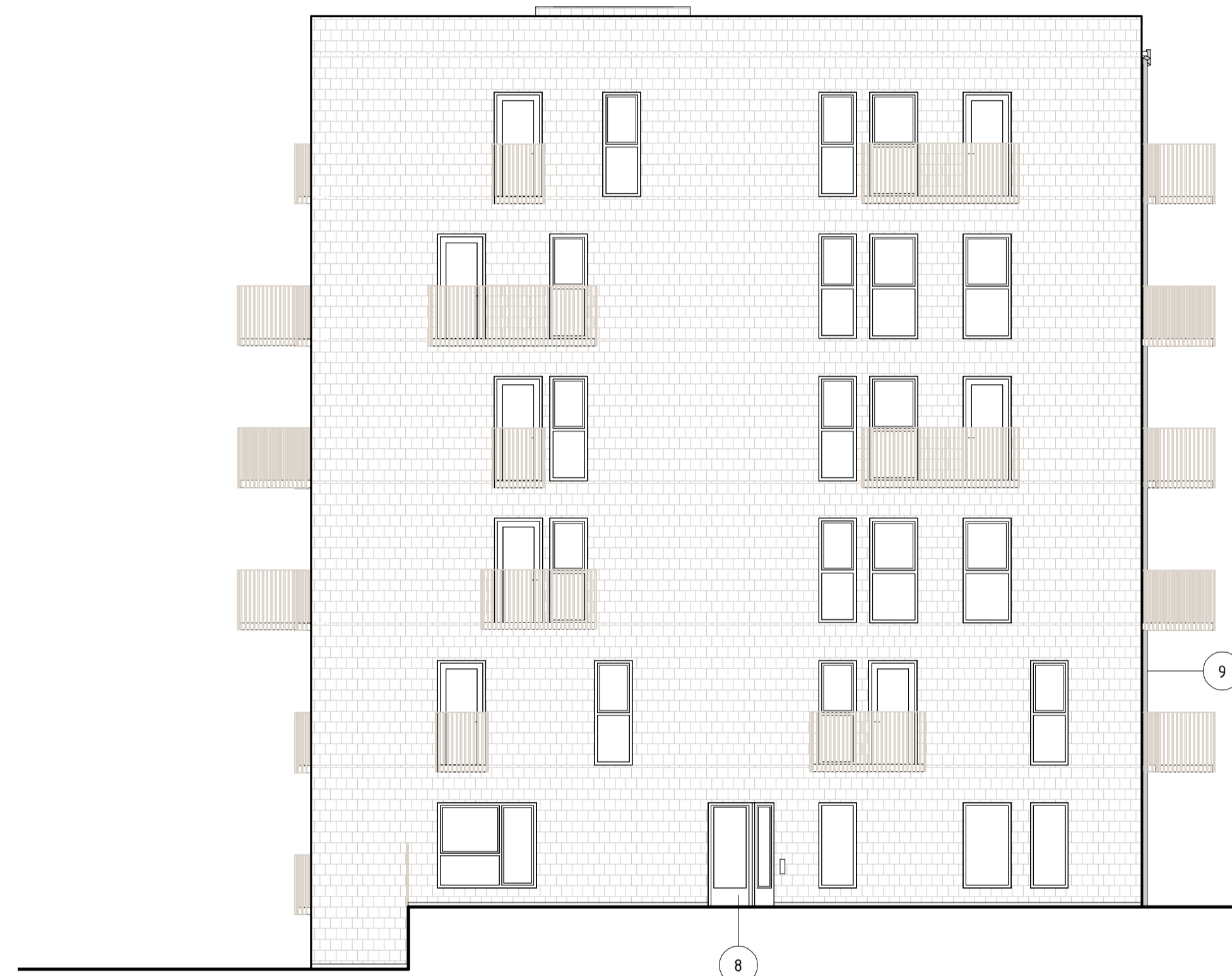
FASAD MOT VÄST, HUS 4 1 : 100