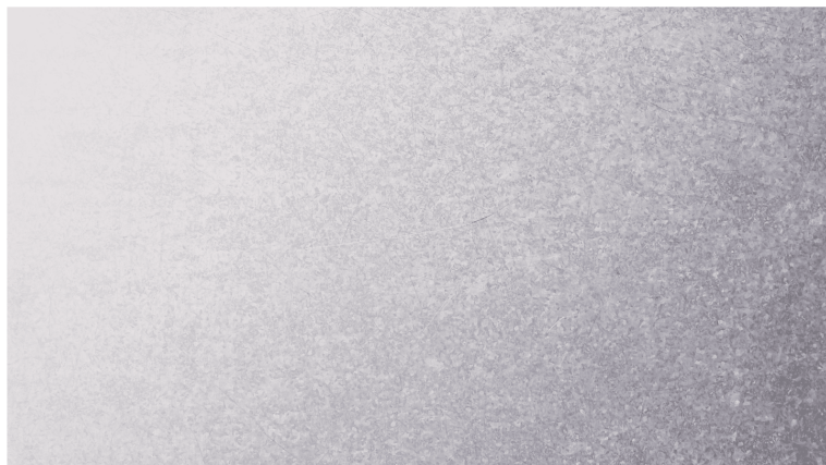
Varmförsinkade ståldetaljer (VFZ)