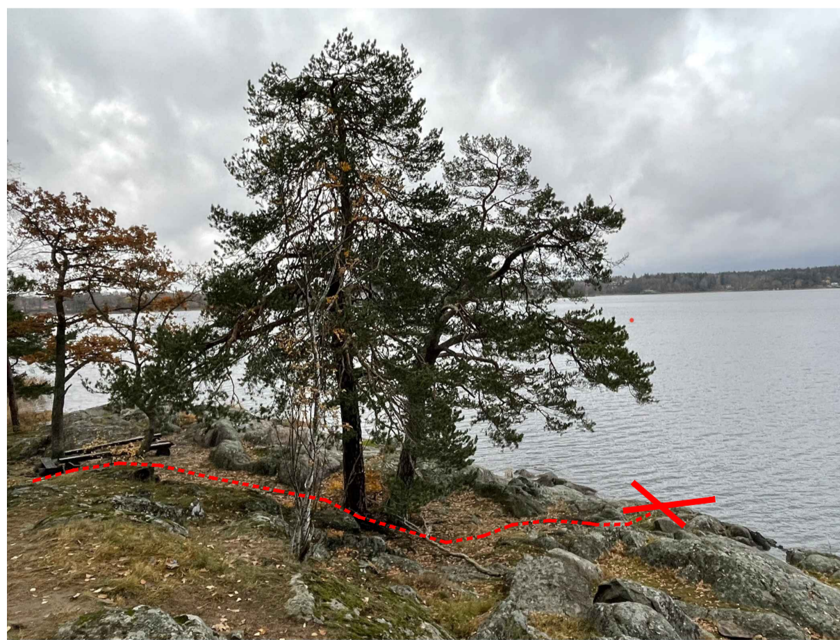
BILD 8, ÖVERSIKT, STIG FRÅN GRILLPLATS TILL PLATS FÖR LANDFASTE (SE KRYSS)