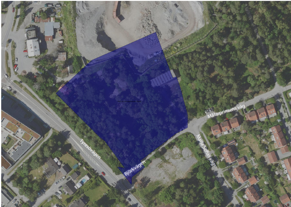
Figur 1. Ortofoto över ungefärligt planområde med omnejd. Planområdet är markerat i blått. Planområdet ligger vid Tyresövägen och Björkvägen.