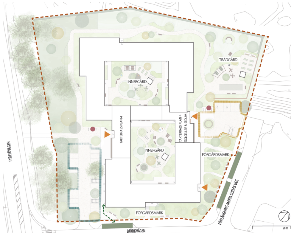
Figur 2. Illustrationsplan med byggnadens placering och omgivande markplanering.

Byggnaden föreslås få en högre nockhöjd än höjden på de närmaste par- och kedjehusen. Det bedöms vara lämpligt att byggnaden är högre än den närmaste bebyggelsen då bebyggelse mot Tyresövägen är tänkt att ge en avskärmande effekt mellan vägen och bakomliggande bostadsområde. Planområdet är en del av ett planerat förtätningsområde där kommunen ser störst potential för en högre exploateringsgrad. Byggnaden blir därför en upptrappning från de lägre parhusen. Byggnaden har dock en lägre höjd mot de befintliga par- och kedjehusen vid Målarprinsens- och Maria Sofias väg för att ansluta till området.