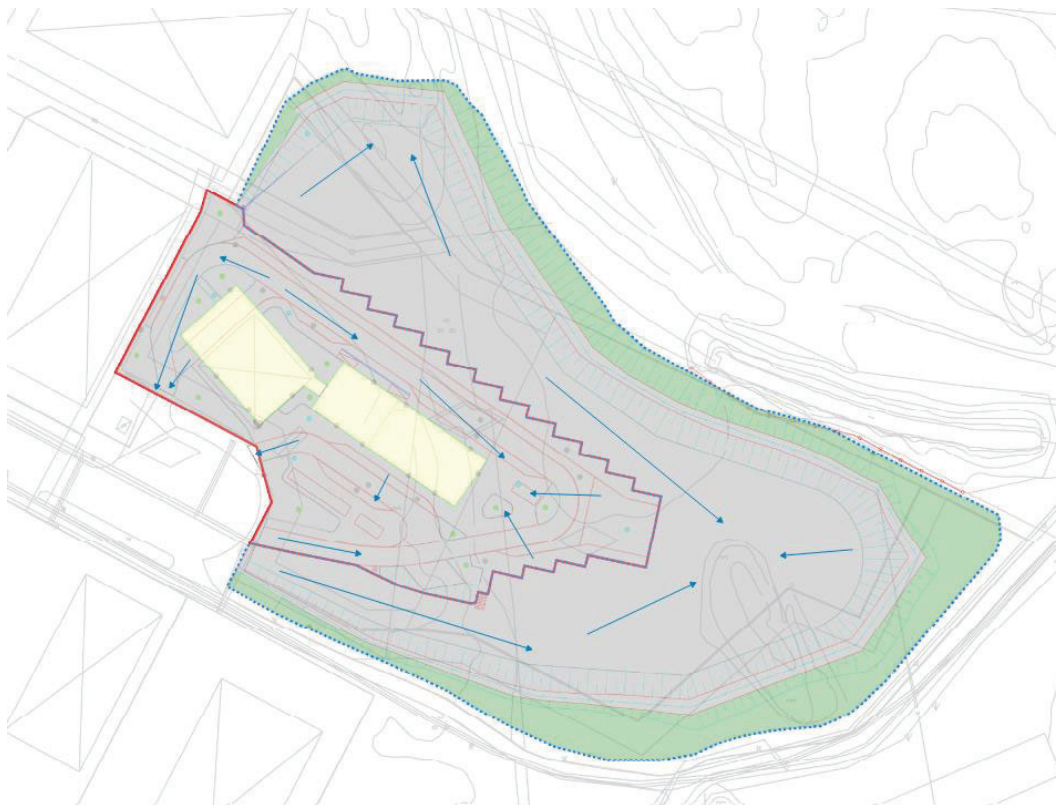
Figur 3. Ytlig avrinning vid planerad höjdsättning.