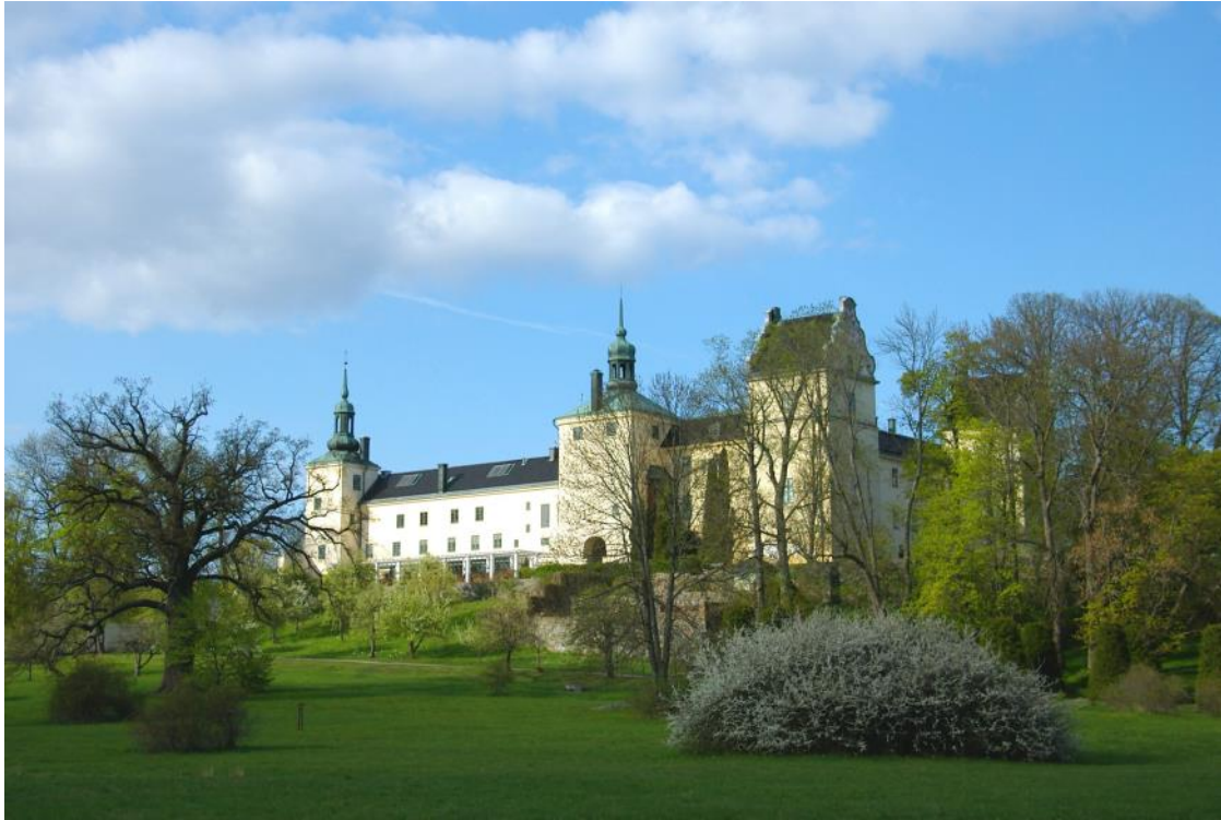
Tyresö slott, Tyresö kommun

SÖDERTÖRNS MILJÖ- & HÄLSO- SKYDDSFÖRBUND