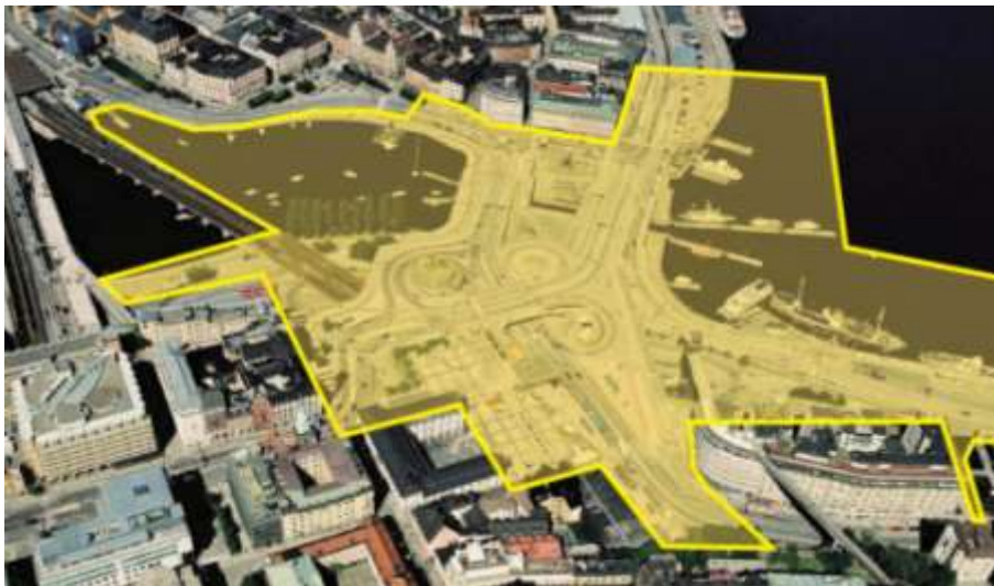
Planområdets utbredning och läge. Flygbild från söder med Gamla stan i bildens överkant och Södermalm i bildens nedre halva. Planområdet avslutas i öster (utanför bildens högra kant) i höjd med Birkaterminalen.

kvarteren utmed Munkbron och Skeppsbron. I öster omfattas vattenområdet från Gamla stan till Stadsgårdsleden i höjd med Birkaterminalen. Mot söder avgränsas planområdet av kvarteret Tranbodarne (KF-huset och Glashuset), befintlig tunnelbaneentré vid Ryssgården samt Stadsmuseet. I väster löper planområdesgränsen utmed kvarteret Överkikaren mot Södermalmstorg. Därefter omfattas delar av området vid Stadsgårdsleden mellan tunnelbanebron och Centralbron. Norr om detta område ligger planområdesgränsen utmed tunnelbanebronns östra sida för att sedan igen möta Munkbron.