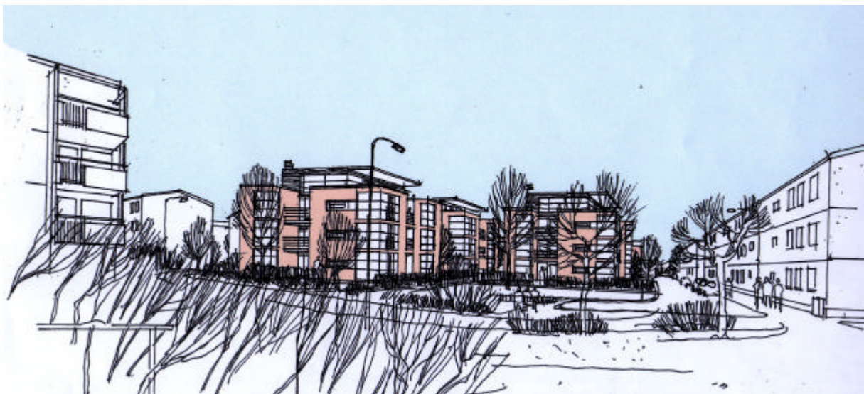
Stadsvillor på Tisslingeplan

Tre stadsvillor föreslås på den västra delen av parkeringsplatsen. Uppskattningsvis kan projektet innehålla ca 50 lägenheter. Ungefär hälften av de befintliga parkeringsplatserna föreslås behållas samt tillåten kantstensparkering vid både Tisslingeplan och Sotingeplan. Längs Tenstastråket ligger elledningar som måste flyttas om den delen av förslaget ska genomföras. Grundläggningsförhållandena är bra.