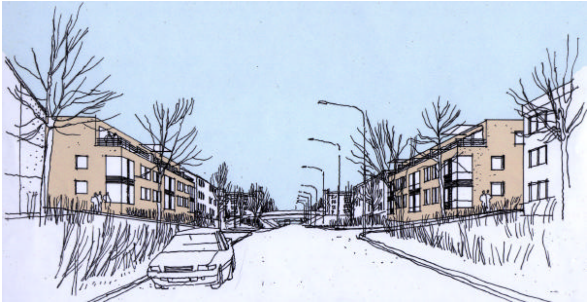
Bostäder mot Tenstastråket

På ömse sidor om Tenstastråket brer två större parkeringsplatser ut sig. För att ge Tenstastråket tydligare sidor föreslås att två byggnader i tre våningar förläggs på ömse sidor om gatan. Tenstastråket har ett flertal byggnader med långsidan mot gatan. Denna uppbyggnad av gaturummet skulle således förstärkas med de två lamellhusen på ömse sidor om Tenstastråket. Byggnaderna kan t ex innehålla studentbostäder eller ungdomsbostäder.