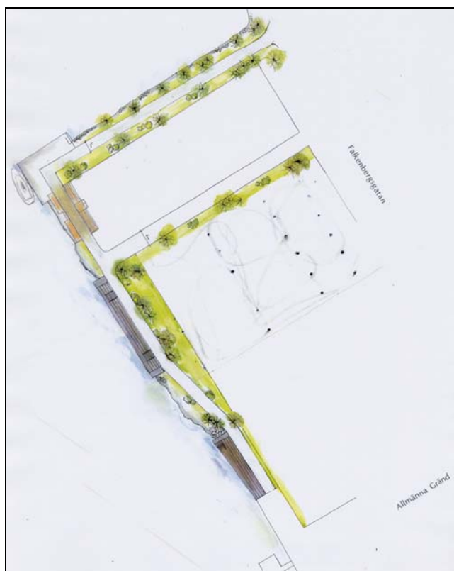
Skiss över Djurgårdsstrand och en ny gränd

Ett av planens syften är att möjliggöra för Aquaria Vattenmuseum AB att med tomträtt få en byggrätt för ett nytt permanent museum på fastigheten Skeppsholmsviken 9.