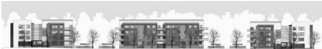
Område A sett från Sockenvägen. Illustration av Lindberg Stenberg Arkitekter.

110 parkeringsplatser, med en norm om 0,2 bilplatser per bostadsrum, tillskapas på kvartersmark. I område A, norr om Sockenvägen planeras parkeringarna mellan husen, överbyggda med sedumtak. En entrégata, parallell med Sockenvägen, löser övrigt behov av parkeringsplatser.