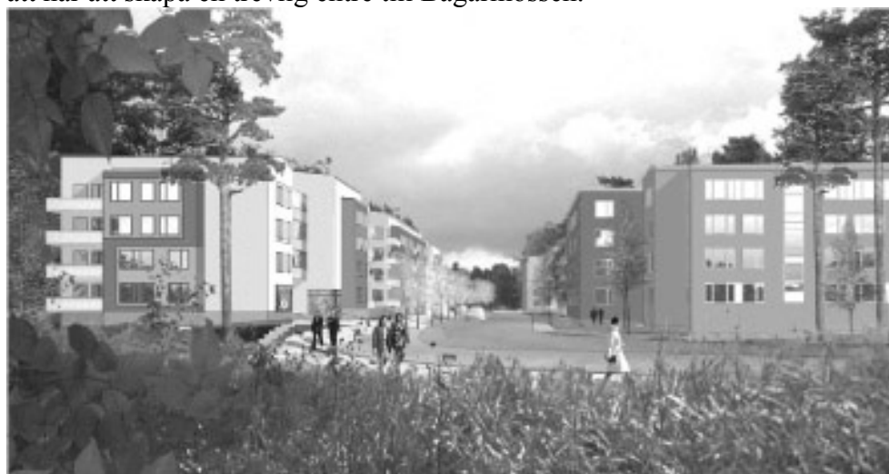
Ny entré till Bagarmossen. Illustration av Lindberg Stenberg Arkitekter.

För att öka orienterbarheten ges Sockenvägen en mer gatumässig utformning som förtydligar dess funktion som huvudgata mellan två stadsdelar. Detta sker samordnat med den ombyggnad som sker av Sockenvägen utmed kv. Gåshällan. Syftet med gaturummet och utformningen av kvarteren är också att här att skapa en trevlig entré till Bagarmossen.