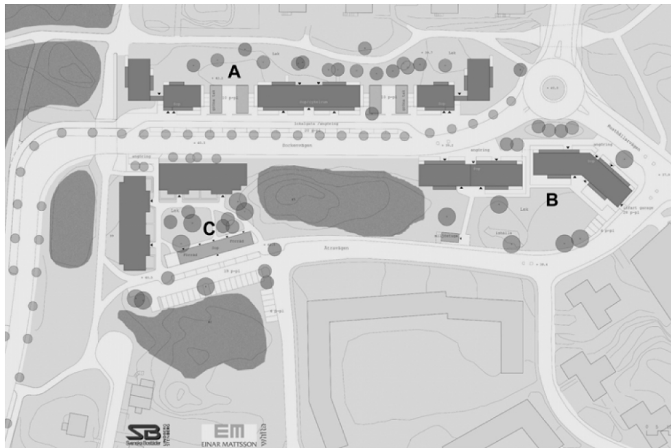
Situationsplan. Illustration av White.

cirkulationsplats anläggs. En berghäll med isräfflor bevaras och skyddas genom planbestämmelse.