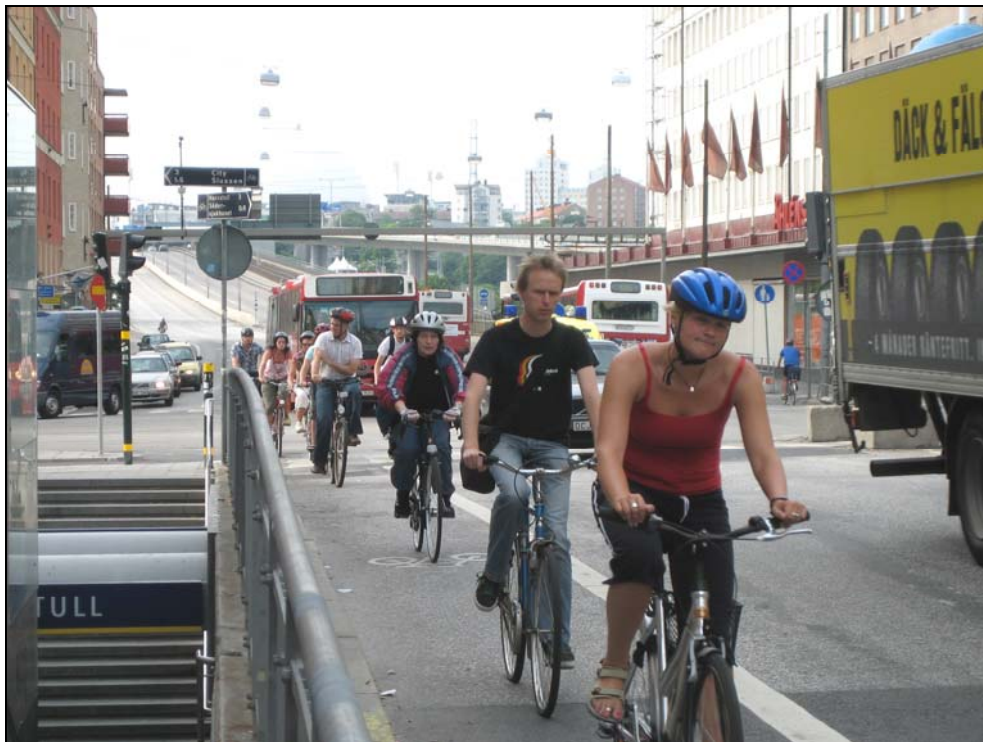
Cyklister vid Ringvägen på väg norrut

Götgatan är en av stadens viktigaste cykellänkar, den trafikeras av ca 6000 cyklister per dygn. Större delen av Götgatan har nu fått fungerande cykellösningar, men kring Skanstull finns ännu stora brister.