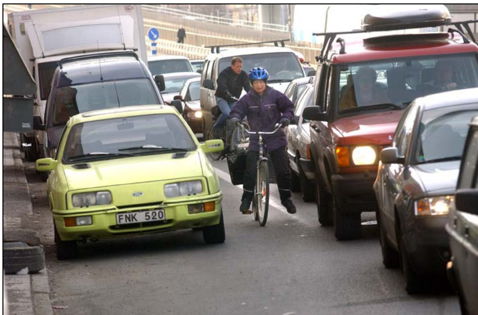
Dagens situation mellan Skanstullsbron och Ringvägen

Mellan Ringvägen och Ölandsgatan finns idag ett väl fungerande cykelfält som behålls. På delen Ölandsgatan – Gotlandsgatan saknas idag cykellösningar helt. Här planeras cykelbana med samma lösning som finns norr om Gotlandsgatan, d.v.s. intill gångbanan och separerad från biltrafiken. Samtidigt som cykelbanor byggs byts trädens växtbäddar på kvarteret.