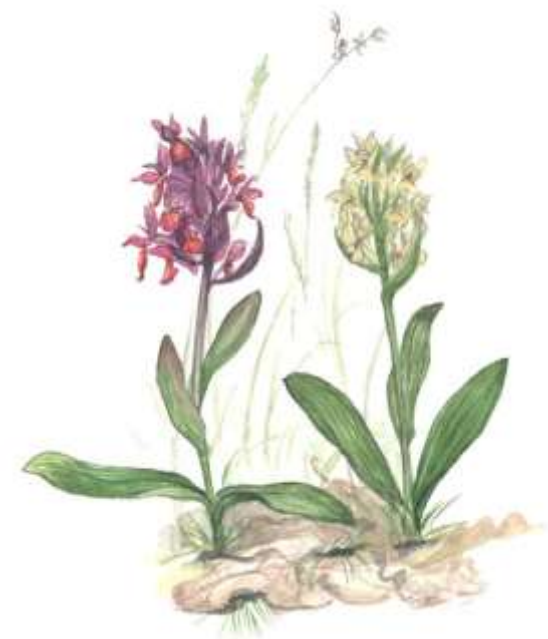
adam och eva

Översiktsplanen (ÖP) beskriver de fågel- och sälskyddsområden samt fiskfredningsområden som finns i Värmdö. ÖP tar även upp förslag till nya områden. Dessa områden tas inte upp i denna version av naturreservatsplan.