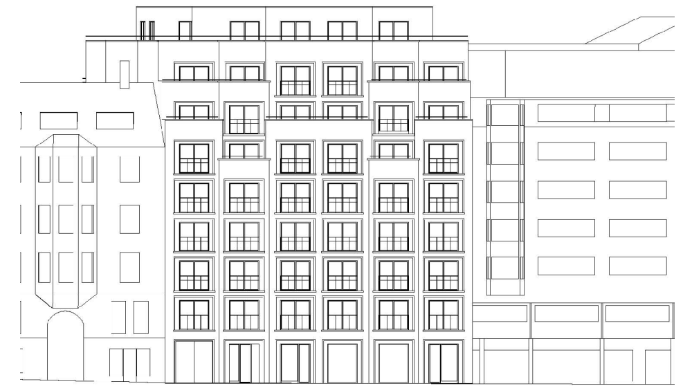
Fasad mot Grev Turegatan

Den tomtindelning (fastighetsplan) som fastställdes 1980-01-24 (akt 0180-B4/1980) upphör att gälla till den del som omfattar Riddaren 24