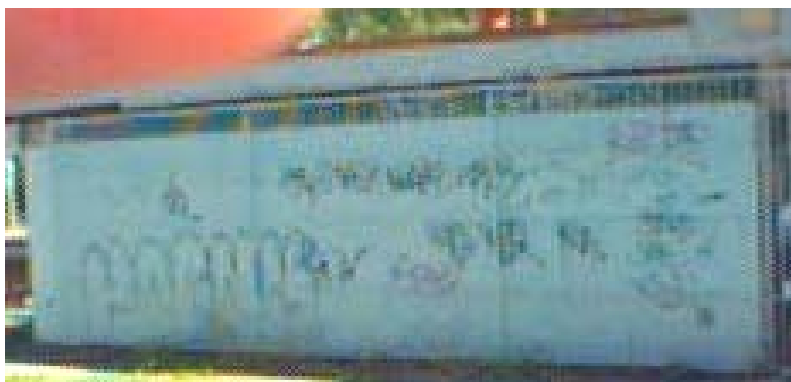
Fotot har tagits i dåligt ljus. Klottret syns inte så bra som i verkligheten