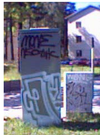
Promenadstråket är fullt av klotter