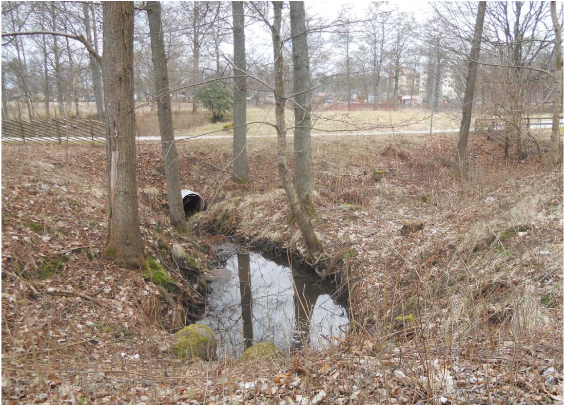
Dagvattenanläggningen vid Replösavägen.

Diket som går genom planområdet är anslutet till dagvattenledningen vid Stafettvägen. Ledningen är sedan kopplad till dagvattenanläggningen vid Replösavägen, se foto nedan. Dagvattenanläggningen ska fungera som översvämningssmagasin vid höga flöden och ta hand om föroreningar. Om vattennivån stiger finns en kulvert under Replösavägen som leder vattnet ut i Lagaån.