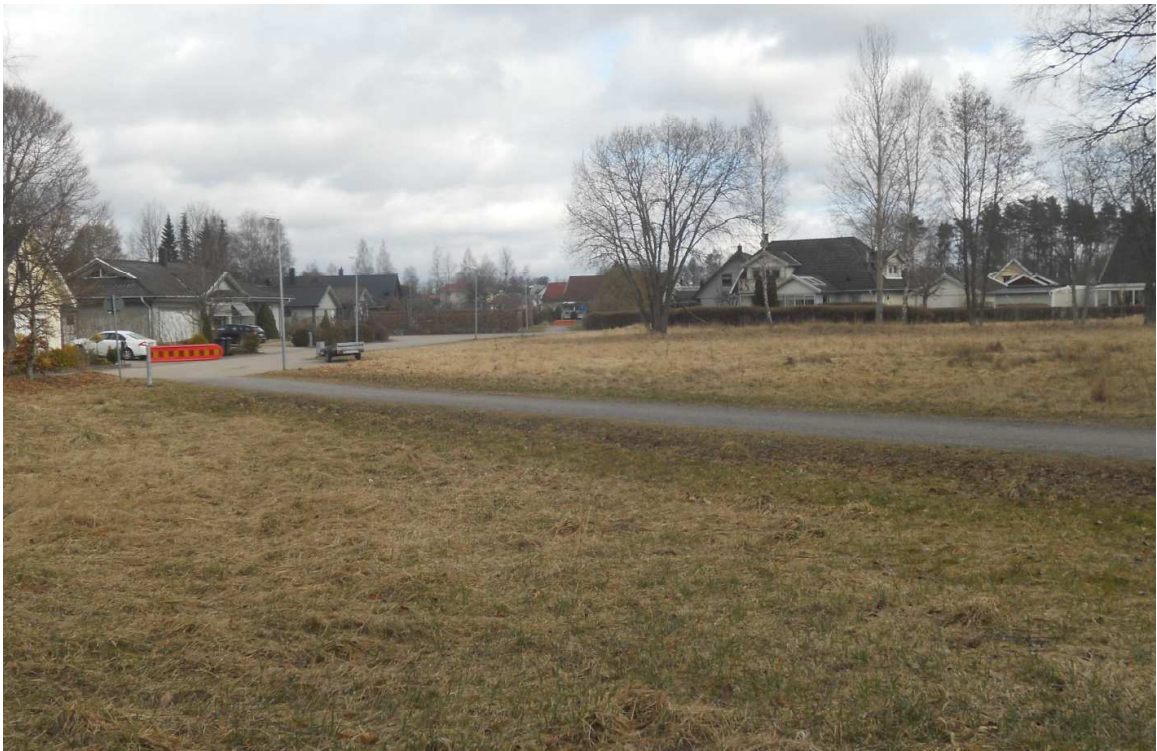
Markområdet inom Replösa 4:40 som avses bebyggas med bostäder.