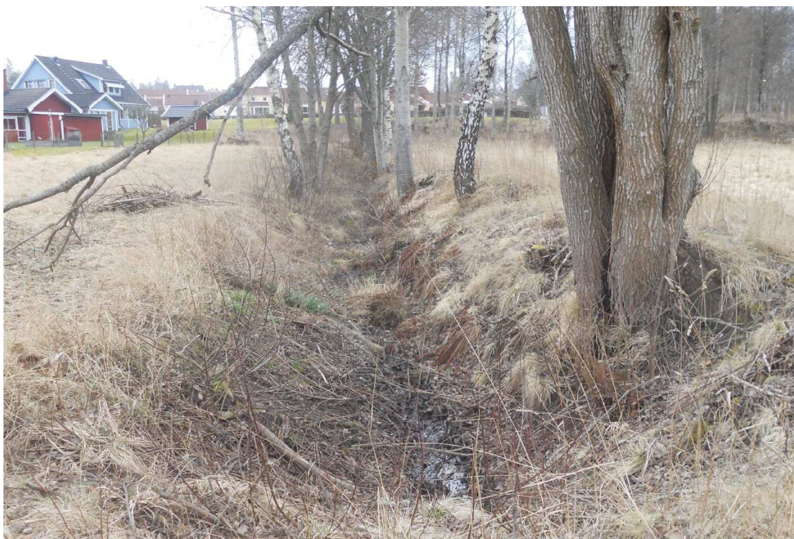
Diket som går genom planområdet.

En stor del av området är en öppen gräsyta som slås med slaghack en gång om året. Eftersom skötseln är begränsad används inte området till något speciellt. Genom området går ett större dike som är anslutet till dagvattenledningen i Stafettvägen. Intill diket står en rad med lövträd av olika slag.