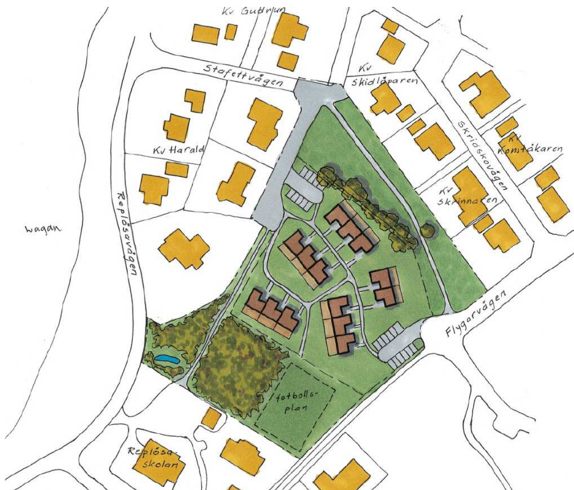
Illustration över hur planområdet kan bebyggas. Detta är ett förslag som visar ungefärligt antal lägenheter som kan rymmas inom området samt en möjlig utformning och disposition av byggnaderna. Utformning av området går att göra på många andra sätt.