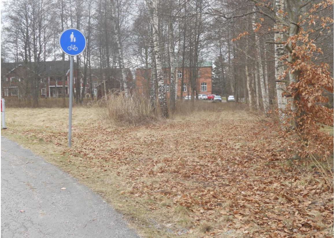
En naturstig leder fram till f.d. Replösaskolan från Stafettvägen.

Lagaån ligger ganska nära planområdet men eftersom vattenståndet regleras vid kraftverket vid Ljungby Energi finns ingen större risk för översvämning inom det planerade området. En översvämningsskartering över Lagaån som MSB (Myndigheten för samhällsskydd och beredskap) genomfört redovisar detta resultat.