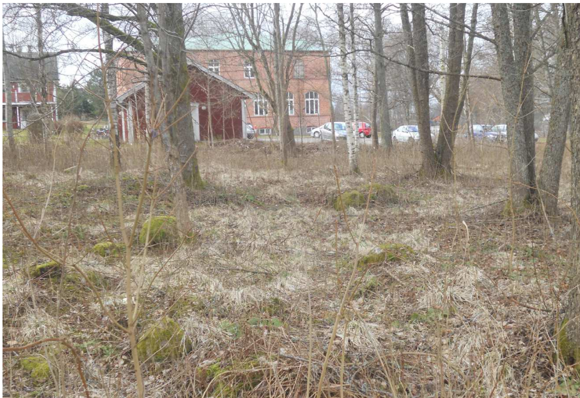
Naturmarken mellan f.d. Replösaskolan och det planerade bostadsområdet.

Enligt grönstrukturplanen, antagen 2000, är parken klassad som grannskapspark. Denna typ av park beskrivs så här: "Det är en park som är 1-5 hektar, men inte klassificerad som skydd mellan bostäder och väg eller del av rekreationsområde." Parkens karaktär kan preciseras som naturpark med följande beskrivning: "En naturpark är en bit skog eller hagmark som sparats och blivit park. Det kan finnas ängsytor som slås en gång om året, men inte klippta gräsytor."