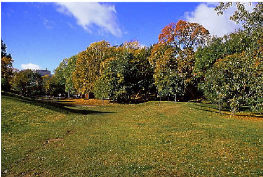
Stora Blecktornsparken hösten 1998

Kågeson har ifrågasatt om jäv kan föreligga då stadsbyggnadsdirektören har barn som går i den aktuella skolan.