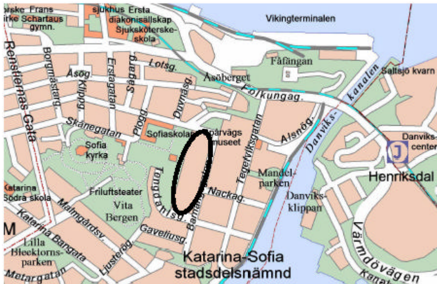
Kartan visar planområdets omfattning