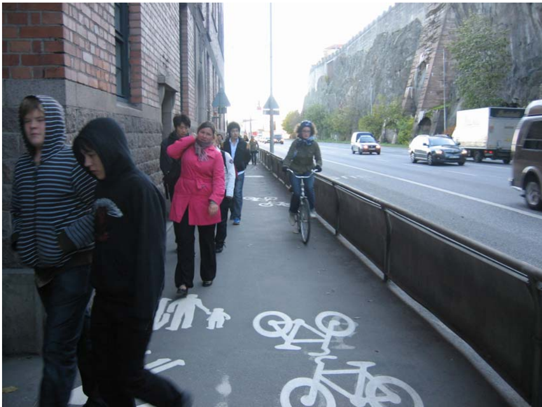
Gång- och cykelbanan vid Stora Tullhuset

Den dubbelriktade gång- och cykelbanan på Stadsgården har en grundläggande funktion och är mycket väl använd av fotgängare på väg till och från kryssningsfartygen, samt av cyklister på väg till och från Nacka/Värmdö. Sektionen är trång på hela sträckan mellan Slussen och Danvikstull, men vid Stora Tullhuset mitt på Stadsgården är sektionen så trång att det dagligen inträffar konflikter, incidenter och ibland även olyckor. Problemen har gradvis förvärrats p.g.a den stora ökningen av turister som kommer med fartygen tillsammans med den stora cykeltrafikökningen. Antalet kryssningsturister har slagit rekord många år i rad, och antalet cyklister har näst intill fördubblats sedan år 2000.