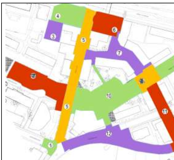
Figur 1 Omfattning programutredning

Utifrån inkomna synpunkter och behov av åtgärder begränsades därefter området för att rymmas inom kontorets budget. Ett par av ytorna som studerats i samarbete med fastighetsägare under programskedet ingår ej i det fortsatta arbetet då de inte ligger på stadens mark. Fortsatt arbete föreslås därför i de allra mest angelägna delarna vilka är de mest centrala där flest människor rör sig. Detta är Spånga stationsplan och Spånga torg, Värsta allé samt vad som under arbetets gång fått benämningarna fickparken och parkstråket (se figur 2).