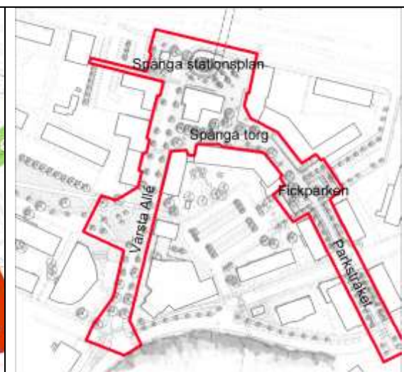
Figur 2 Avgränsning fortsatt arbete