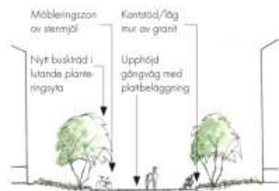
Sektion genom parkstråket

I förslaget tas befintliga träd bort och ersätts av mindre, flerstammiga blommande träd med låga buskar som undervegetation. Stora exemplar väljs för att skapa en grön volym från början. Gångvägen höjs, rätas upp och breddas. En möbleringszon för t.ex. soffor och cykelställ, skapas mellan gångvägen och planteringsytan. Det breddade, förhöjda och upprätade Parkstråket kommer att bli generöst, luftigt och lättorienterat.