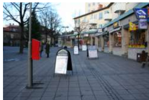
Torget's norra fasad