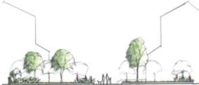
Sektion från söder genom fickparken