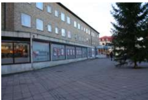
Torget's södra fasad

Spånga torg ger ett trevligt intryck med uppvuxna träd, torghandel och ett flertal välbesökta butiker. De flesta butiksentréerna är dock inte tillgänglighetsanpassade och har ett eller flera steg mellan mark- och golvnivå. Några av träden och en del av utrustningen samt ytbeläggningen är i dåligt skick.