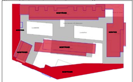
Bild över fördelningen av kontor och bostäder