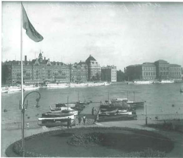
Båtar vid Strömparterren 1928

Ytterligare information och bilder ur historien finns i bilaga 4 och 5, utdrag ur två historiska rapporter.