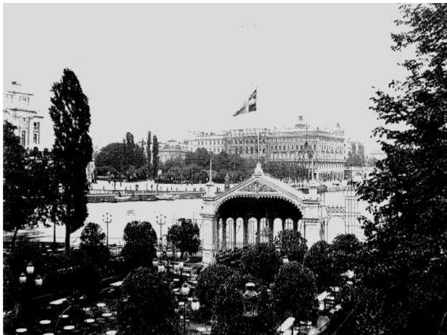
Musikpaviljongen på Strömparterren

Från 1870-talet fram till 1909 fanns en musikpaviljong som stod i parterrens fond vid vattnet, vänd mot Norrbro. Efter rivning av paviljongen användes Norrbros valv till litterära kabaréer och musikuppträdanden