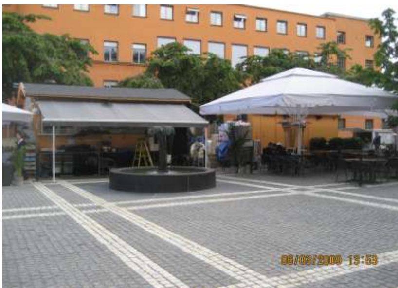
Bild: Serveringsverksamhet under uppbyggnad 2009.

Kontoret anser att verksamheten börjar ta för mycket plats av torget och att gestaltning och omfattning därtill varit illa anpassad. Dels bör inte befintlig fontän skymmas utan ha sitt erforderliga utrymme för att synas. Bänkar längs mur vid infarten bör kunna nyttjas, vilket inte är möjligt med en vägg av byggnader som skymmer torget. Befintligt träd bör även lyftas fram. Allt det tillsammans gör torget mer tillgängligt för allmänheten.