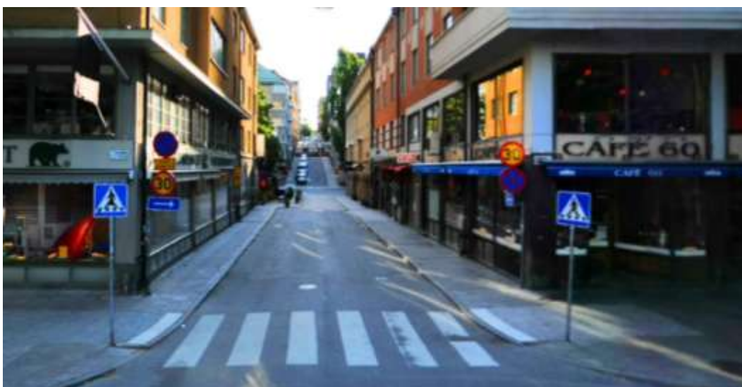
Vy fr n Sveav gen