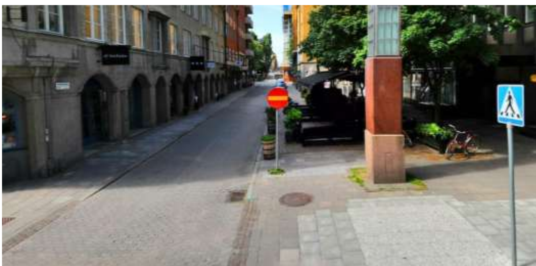
Vy fr n Luntmakargatan

Sedan 2007 har medborgare och aff rsinnehavare drivit fr gan om att omvandla Kammakargatan mellan Sveav gen och Luntmakargatan till g gata. Ett medborgarf rslag st llt till Norrmalms stadsdelsn mnd har besvarats med ett t jansteutl tande fr n stadsdelsf rvaltningen d r trafikkontoret ombeds att utreda fr gan.