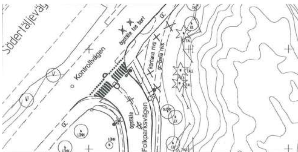
Bild 2: Föreslagen lösning vid korsningen Kontrollvägen/Folkparksvägen

Korsningen Folkparksvägen/Kontrollvägen avser trafikkontoret att bygga om under 2011, för att förbättra trafiksäkerheten för gång- och cykeltrafik.