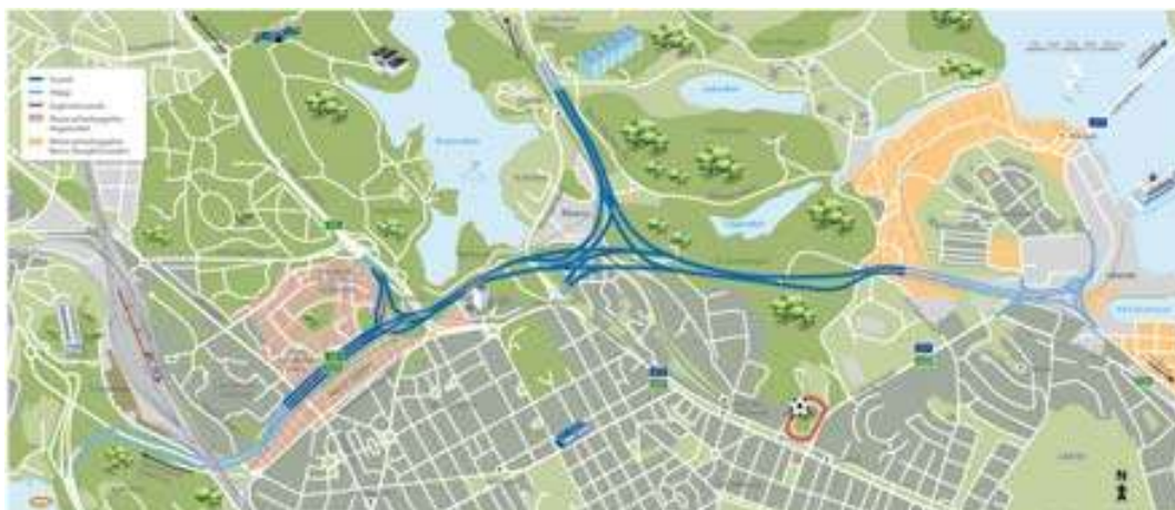
Norra länkens sträckning inkl sträckan Tomtebodavägen - Norrtull

Norra länken utgör den framtida övergripande trafikleden i öst-västlig riktning norr om Stockholms innerstad. Utredningar och analyser av Norra länkens sträckning och utformning har pågått sedan 1960-talet. Sträckning och utformningen har förändrats över tiden. Den senaste förändringen är etappen Tomtebodavägen - Norrtull som är föranledd av utbyggnaden av Norra Stationsområdet. Här byggs en ny stadsdel, Hagastaden. En förutsättning för denna förändring är att väg E4/E20 samt Värtabanan däckas över. Byggnationerna startade 2010.