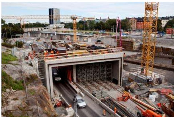
Intunnling och breddning av trafikleden E4/E20 vid Hagastaden samt intunnling av Värtabanan.

Den permanenta järnvägsbron kommer att slutföras under 2012. På grund av trafiksäkerhetsskäl har den fortsatta byggnationen av blindpelarna under järnvägsbron avbeställts. De pelare som redan har hunnit byggas ska i ett senare skede tas bort.