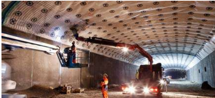
Inne i Albanoberget förses tunnelarna med vattentäta innervalv som skyddar mot dropp och isbildning.

Trafikomläggning av Roslagsvägen till dess slutliga läge är utförd. Arbetet under vägen/betongdäcket fortgår. I november godkändes slutbesiktningen för två stora tunnelentreprenader, Betongtunnlar Albano och Bergtunnlar Teknikhöjden. Installatörernas arbete kommer nu att ta vid. Även i den tredje och sista bergentreprenaden i Roslagstull, Bergtunnlar Värtan, är samtliga bergarbeten avslutade. Där pågår nu betong- och markarbeten samt montage av inredningsvalv. Entreprenaden kommer att slutföras under 2012.