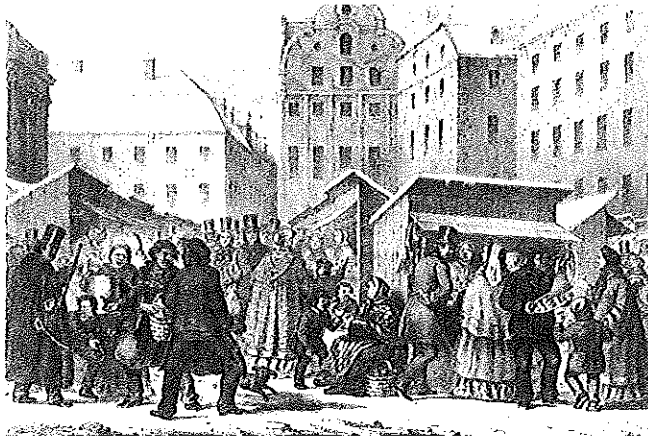
Julmarknaden på Stortorget 1859. Äldre förebild för dagens bodar, vilka ritats av arkitekten Nils Tesch 1962

Stockholms-Gillet, som återupplivade marknaden och driver den sedan 1915, är en ideell förening med omkring 500 medlemmar. Överskottet från marknaden går till stipendier och stöd till Stockholmsforskning - årligen ges stöd till utgivande av 4-5 skrifter om Stockholms historia. Bidrag ges även till behjärtansvärda åtgärder som gatubelysning i Gamla Stan, restaurering av skadade eller förfallna byggnader, m m.