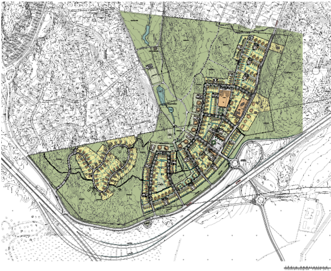
Föreslagen bebyggelse i Hedvigslund, Nacka kommun