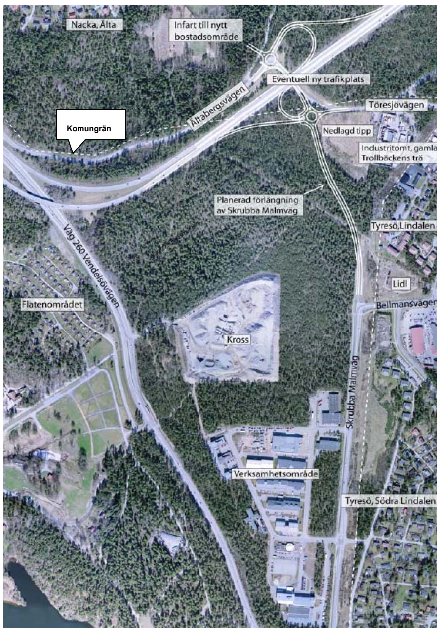
Anslutningen till Töresjövägen kommer att utformas som en t-korsning. Om Skrubba trafikplats byggs ut planeras anslutningen i stället ske via en cirkulationsplats.