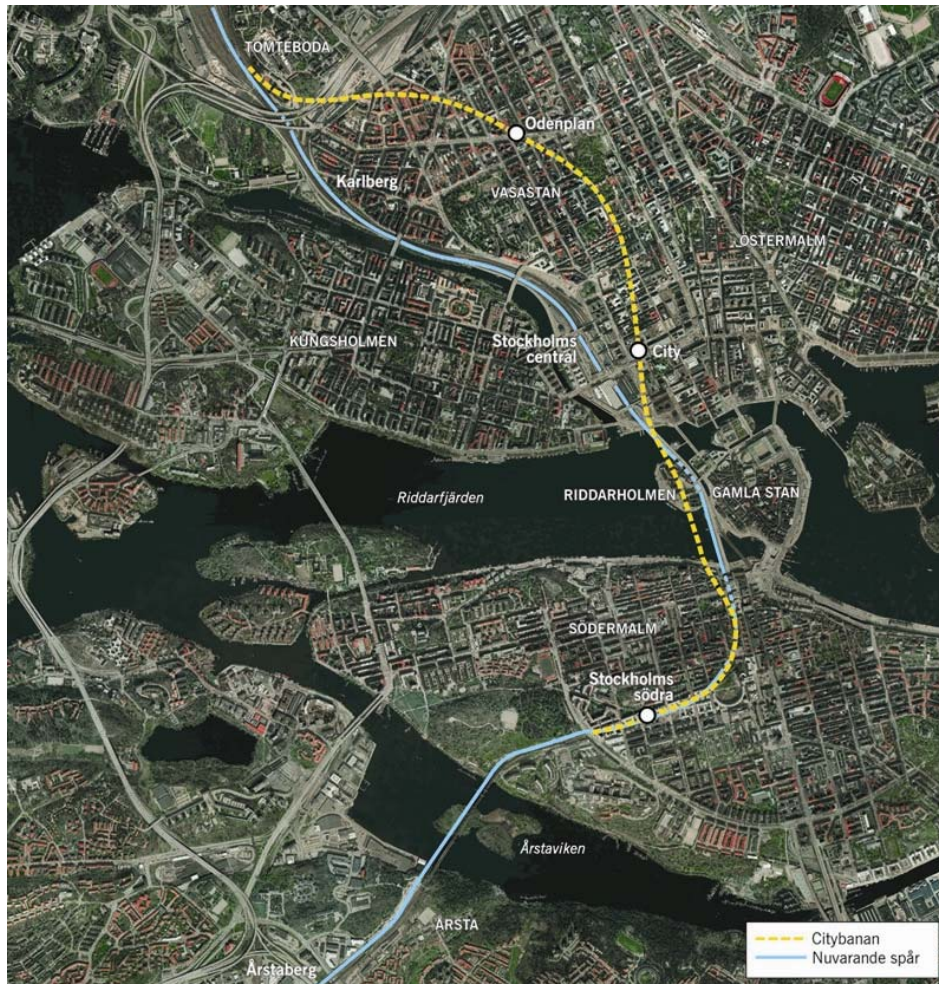
Fig. 1. Citybanans sträckning under Stockholms innerstad