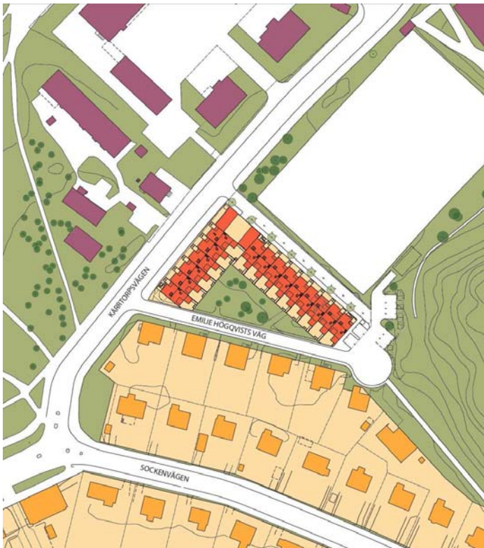
Illustration A1 arkitekter