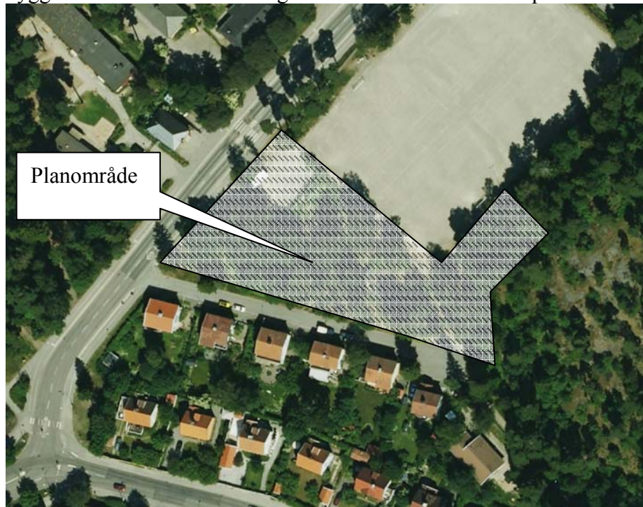
Ortofoto över planområdet

Marken inom planområdet utgörs till stor del av plan naturmark. I väster finns en grusbelagd parkeringsyta med 15 p-platser. Inom planområdet finns idag en liten byggnad som idrottsförvaltningen arrenderar ut till Kärrtorps bollklubb.