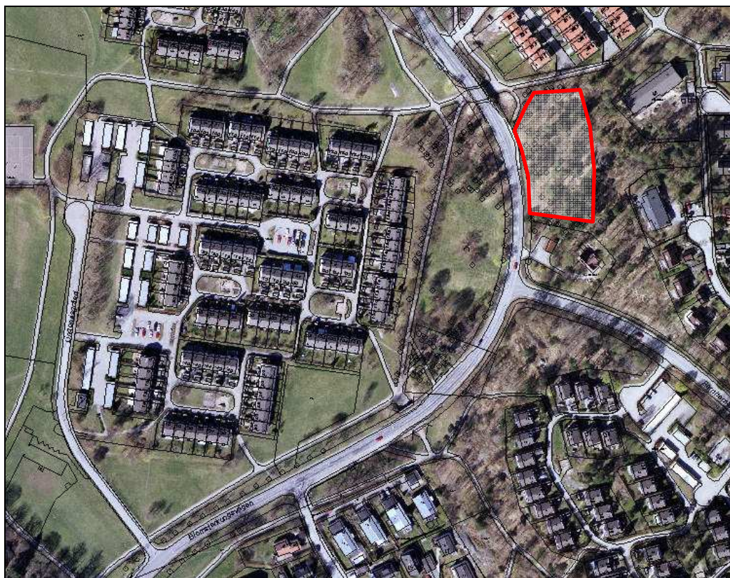
Markanvisningsområdet vid Blomsterkungsvägen omfattar ca 3 500 kvm