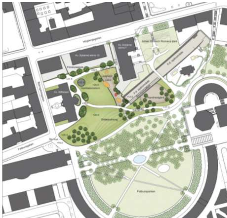
Principskiss på framtida parkutformning.