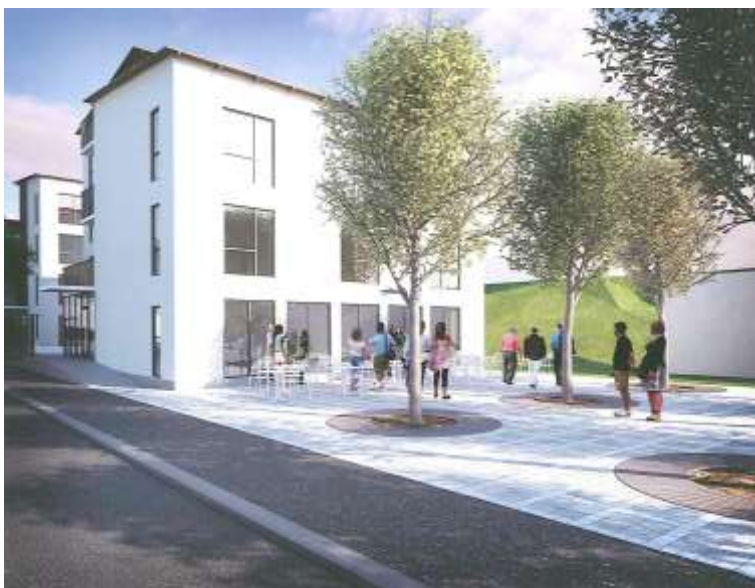
Illustration till föreslagen bebyggelse, mot nordöst