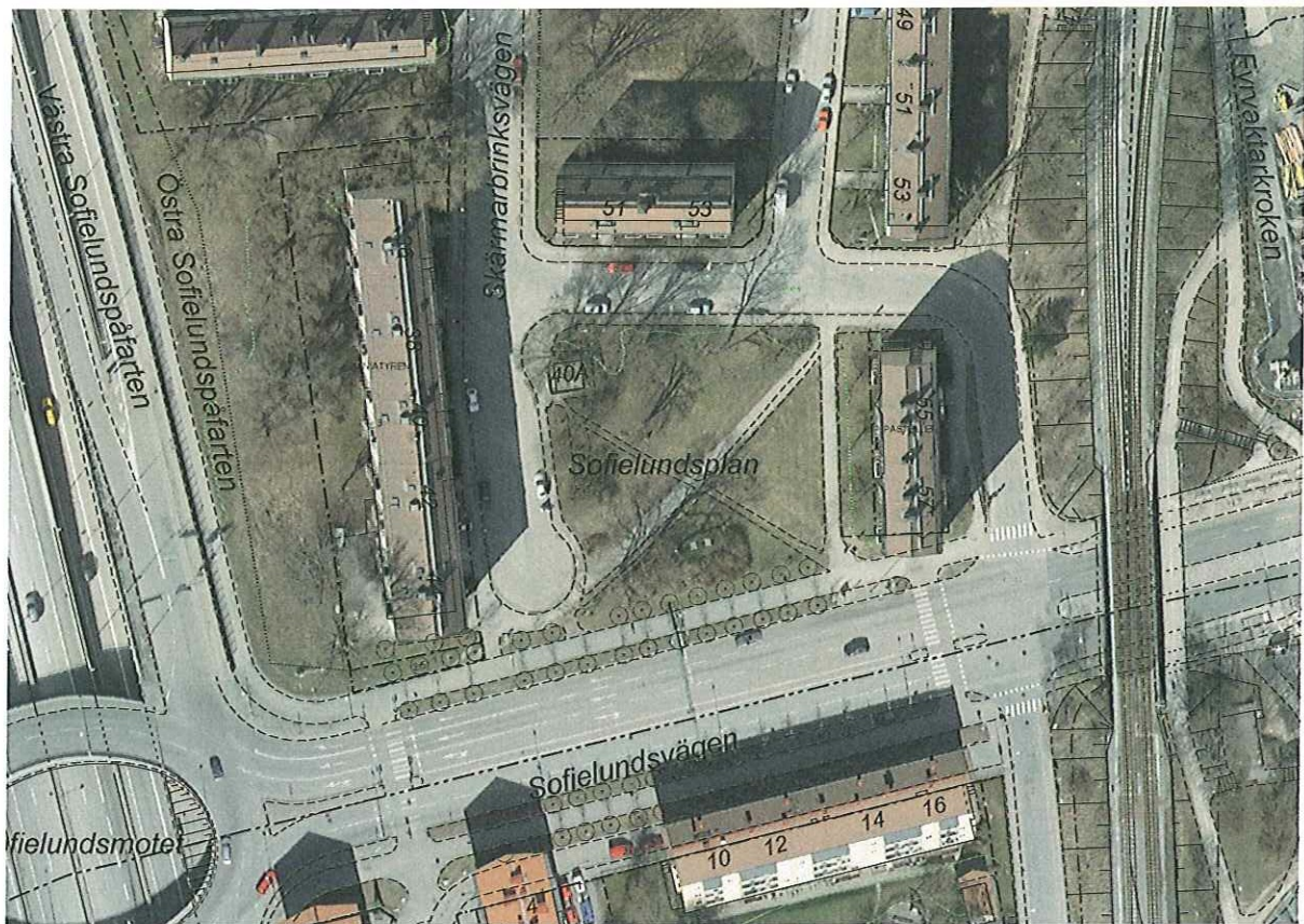
Skala ca 1:1000