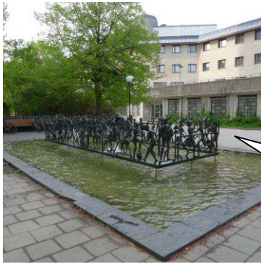
Fontänen från 1963 placerad på gården i vinkeln mellan höghus och lågdal

På den öppna platsen i vinkeln mellan låghusdelen och höghuset ligger en rektangulär, grund bassäng med fontän. Runt fontänen löper en genombruten, rikt formad, figurativ fris i brons där konstnären Emil Näsvalld har skildrat människor i arbete, på fritiden och till fest. Frisen är utförd 1963.