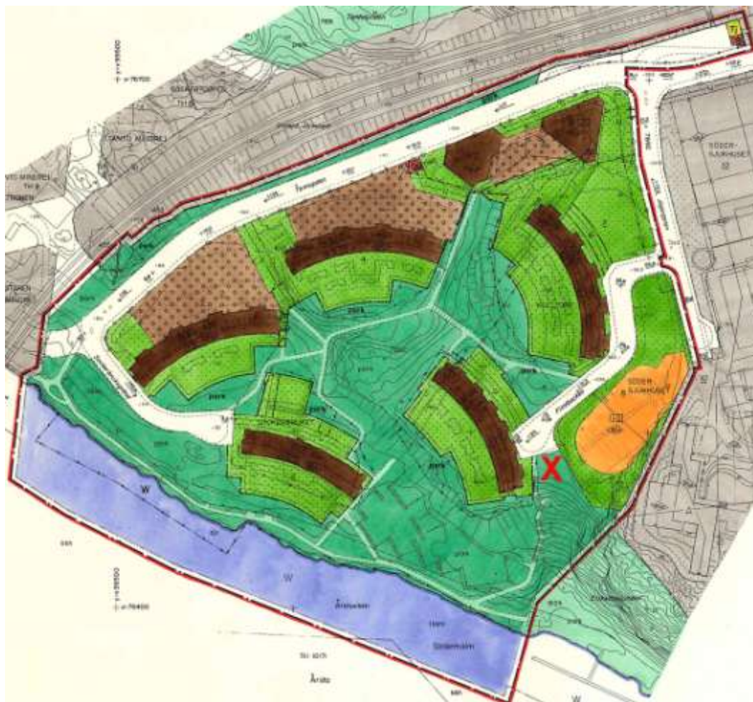
Gällande detaljplan PL 6930A, antagen 1977

Området mellan Flintbacken och Jägargatan, kvarteret Södersjukhuset 8, är kvartersmark som är planlagd för garage i högst tre våningar och används för markparkering. Kvartersmarken ägs av HSBs Brf Tanto och staden har inte rådighet över marken.