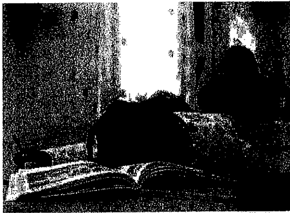
Sagal blir trött av "Mästerkatten".