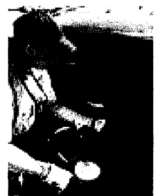
Öka trycket med tio procent, så blir färden både säkrare och renare.

■ Ha huvudstöd och trepunktsbälte på de platser som används samt whiplashskydd.