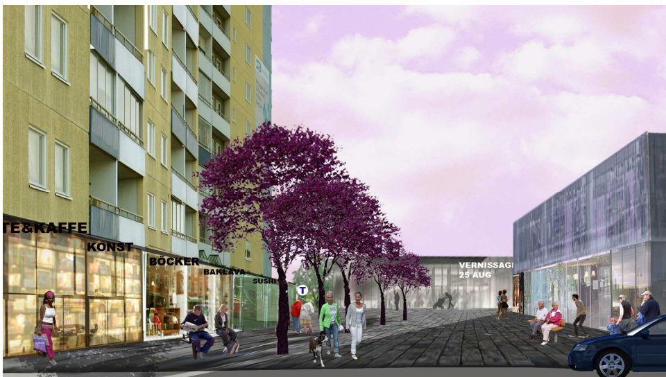
Idéskiss över nya västra torget

I strukturplanen föreslås att centrumaktiviteterna koncentreras kring Husbys västra tunnelbaneentré vid Trondheimsgatan. Det är här som den nya axeln till Kista – Kista Allégata – föreslås mynna. Nya butiker och förhoppnings ett nytt kulturhus skulle kunna ge ett helt nytt anslag till platsen. Edvard Griegsgången behöver allmänt förnyas genom nya eller upprustade lägre byggnader.