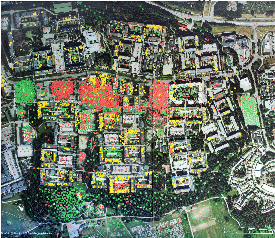
Husbybornas synpunkter om sin stadsdel 2009

Husby är välbeläget intill Kistas och Akallas stora arbetsplatsområden, Järvafältets och Hanstas högklassiga naturområden samt Kistas regioncentrum. Kommunikationerna är goda med bl a två tunnelbaneuppgångar. Lägenheterna upplevs som välplanerade. Husens starka färgsättning är intressant och uppenbara landskapskvaliteter finns i stadsdelen. Andelen invånare i Husby med utländsk bakgrund är högre och inkomsterna lägre än i grannstadsdelarna. Jämfört med Akalla och Kista har Husby en betydligt större andel hyreslägenheter och få arbetsplaster samt saknar helt småhus. Sammantaget finns ca 4 800 lägenheter varav en femtedel är bostadsrätter. Antalet invånare uppgick till 11 400 år 2009.