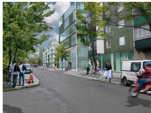
Trondheimsgatan idag t v och delvis enl pågående detaljplanearbete t h