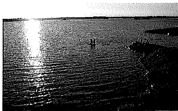
Vy mot St Annas skärgård från badplatsen.

Informationsmötet hölls i slutet av juni på Norra Real. Såväl föräldrar som barn deltog. Kolloverksamheten presenterades på olika sätt av ledare och föreståndare. Barnen ställde frågor om t.ex. läggtider och godisregler.