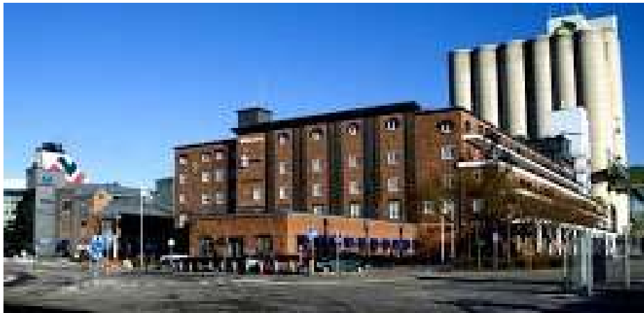
Bild 1, Magasin 3 Frihamnen