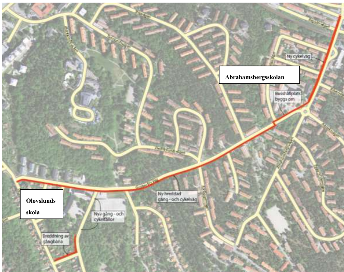
Figur: Föreslagna trafiksäkerhetsåtgärder och gång- och cykelbana förbi Olovslunds skola och Abrahamsbergsskolan.