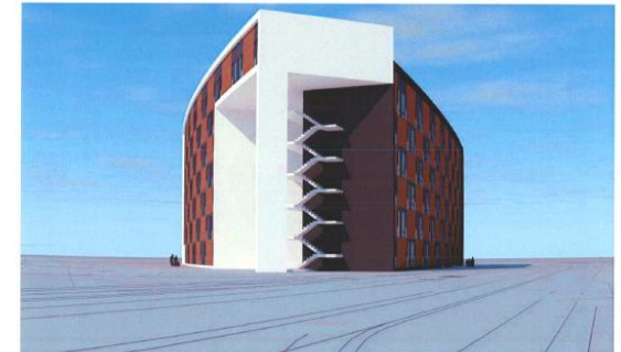
HJORTHAGEN KV V4 VOLYMSTUDIER 2008-11-25